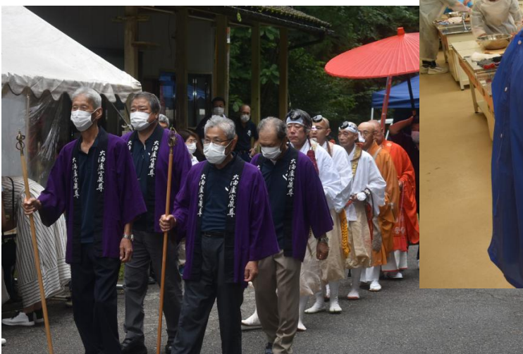
大満虚空蔵尊ご開帳