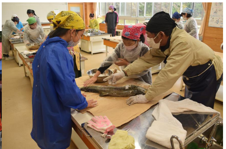
さくら小学校 鮭の塩引き体験