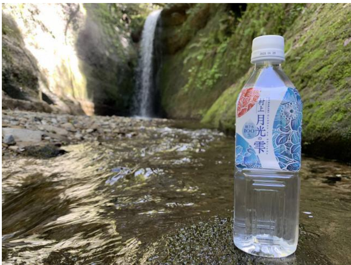
村上市ボトルドウォーター「月光の雫」