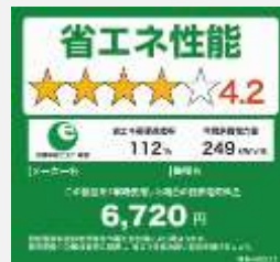
<統一省エネラベル>