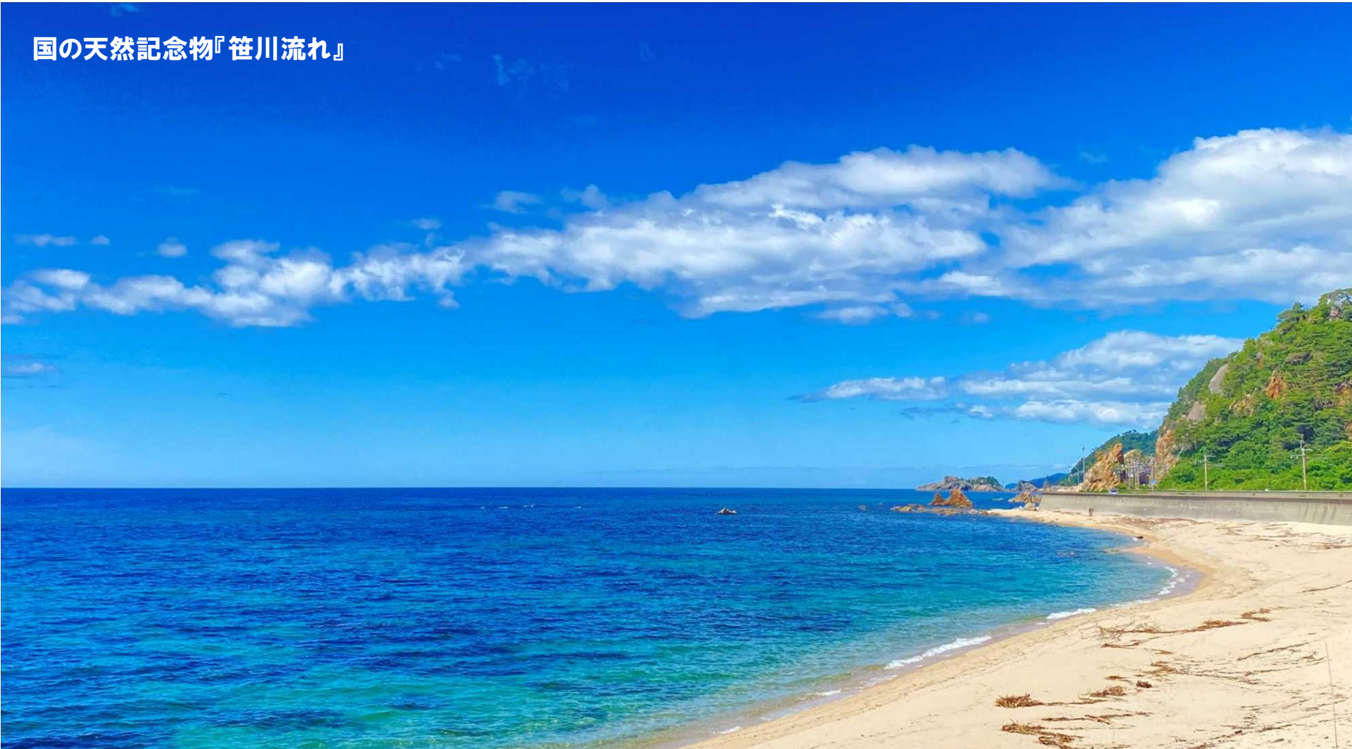
国の天然記念物『笹川流れ』

一度、村上高等学校の魅力や様子、住まいの雰囲気や村上の地域と環境を直接肌身で体感してみませんか。