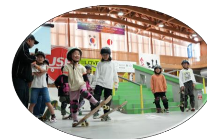
ブルボンスケートパーク村上