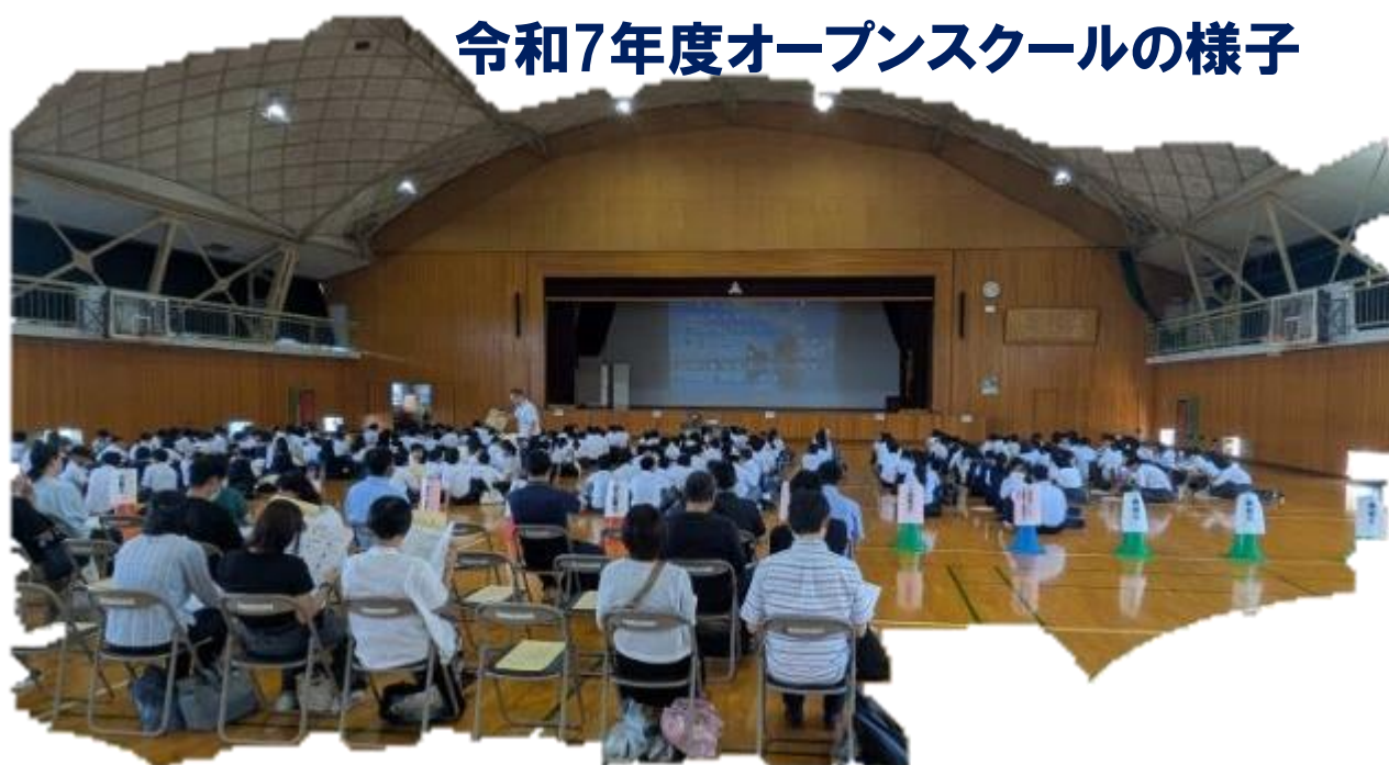
令和7年度オープンスクールの様子