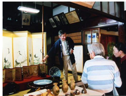
図 町屋の屏風まつり