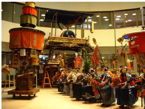
図 郷土資料館の展示