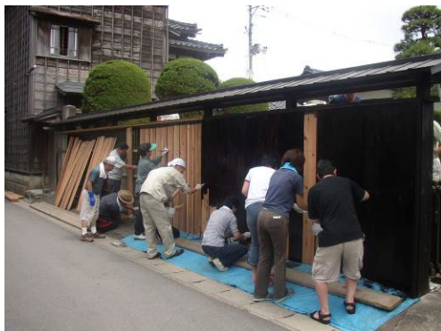
図 黒塀プロジェクト

今後も、各地域のまちづくり組織と連携を図り、各地域のまちづくり組織以外の各種団体については、多様な活動をさらに推進するため協議、連携を図りながら必要な情報を提供し、人材の育成や支援の充実を講じる等官民一体となった文化財の保存及び活用体制の構築を目指し、検討する。