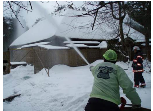
図 若林家住宅における消防訓練

今後も、これらのまちづくり団体等と相互連携を図りながら、引き続き広報やホームページ等による周知を図るほか、デジタルデバイスを活用したマップの整備・普及等を行う。また、報道機関等にも積極的に情報提供を行いながら、文化財等の公開活用や歴史、文化に関する普及啓発を推進する。