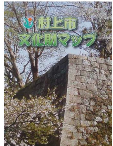
図 村上市文化財マップ

また、文化財の公開活用を推進し、所有者や管理者等と協議、連携しながら誰もが文化財を気軽に見学し、親しむことのできる機会を検討する。また、各地域のまちづくり協議会や民間まちづくり団体と相互連携を図りながら、文化財等の公開活用や歴史、文化に関する普及啓発を推進する。