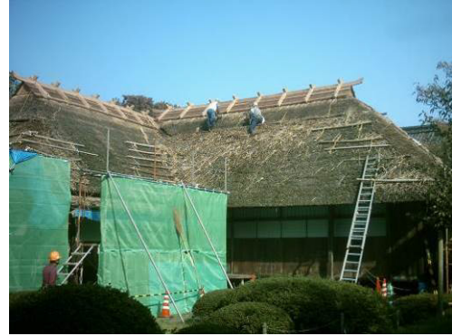
図 若林家住宅の茅葺き屋根の修復