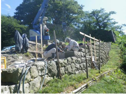
図 村上城跡の石垣の修復

史跡である村上城跡の修理、整備については、「史跡村上城跡保存活用計画」に基づき実施する。また、重要文化財である若林家住宅や浄念寺本堂、市の指定文化財である旧嵩岡家住宅等の指定文化財等については、現状修理を基本としながら文化財として価値の確実な保存を図る。