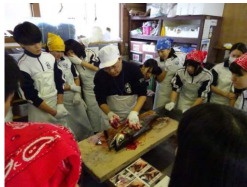
図 塩引き道場の様子