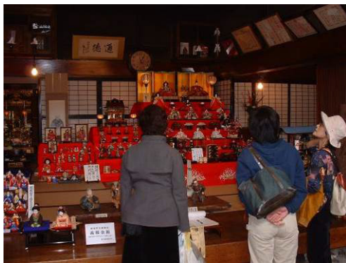
図 町屋の人形さま巡り

今後も、これらのまちづくり団体等と相互連携を図りながら必要な情報を提供し、文化財等の公開活用や歴史、文化に関する普及啓発を推進する。