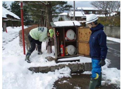
図 文化財に設置された消防設備