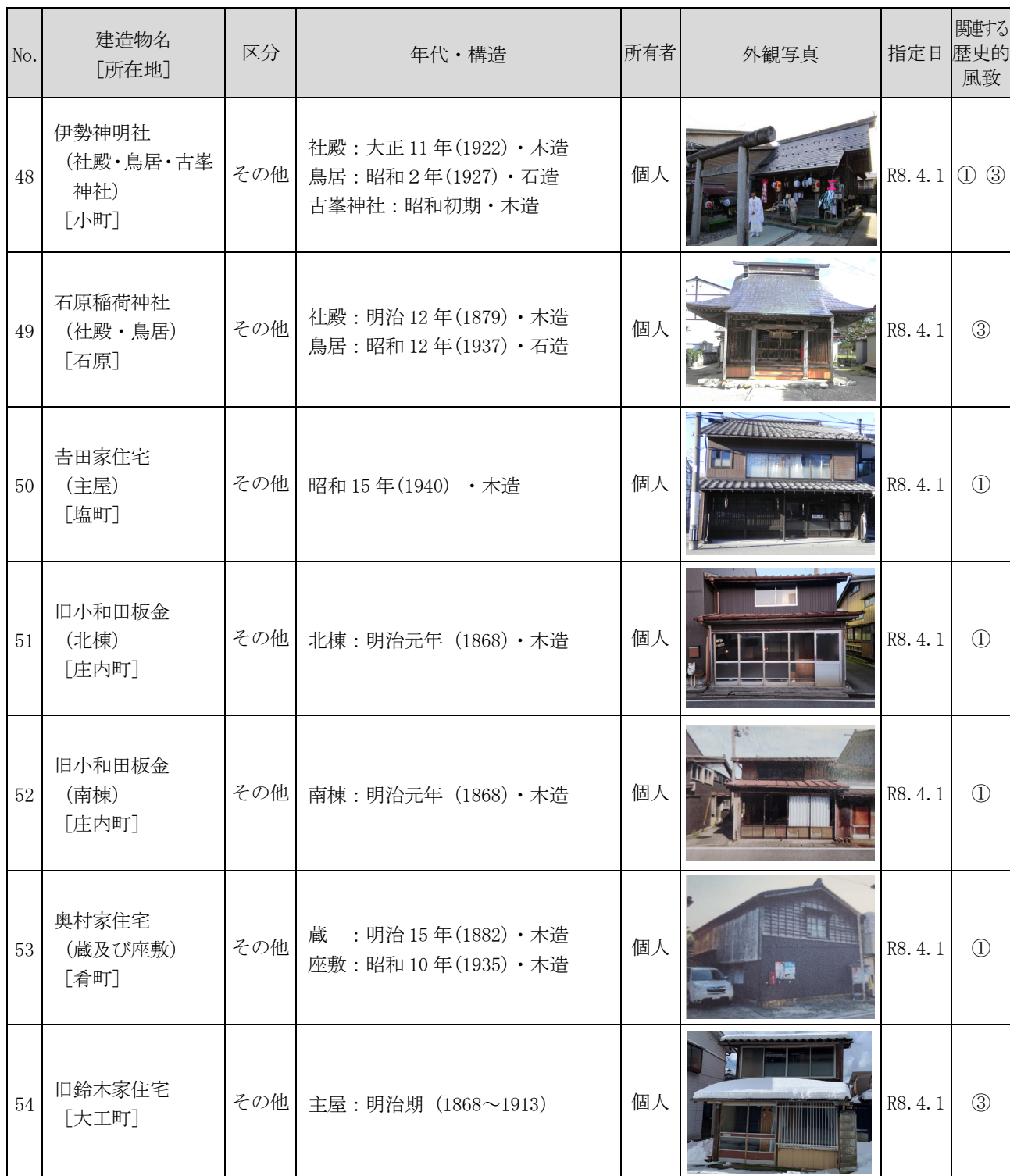
表 歴史的風致形成建造物の指定候補

※関連する歴史的風致 ①：村上城下の祭礼にみる歴史的風致 ②：種川の制など鮭文化にみる歴史的風致 ③：村上城下の木と漆の匠にみる歴史的風致 ④：北限の茶処にみる歴史的風致