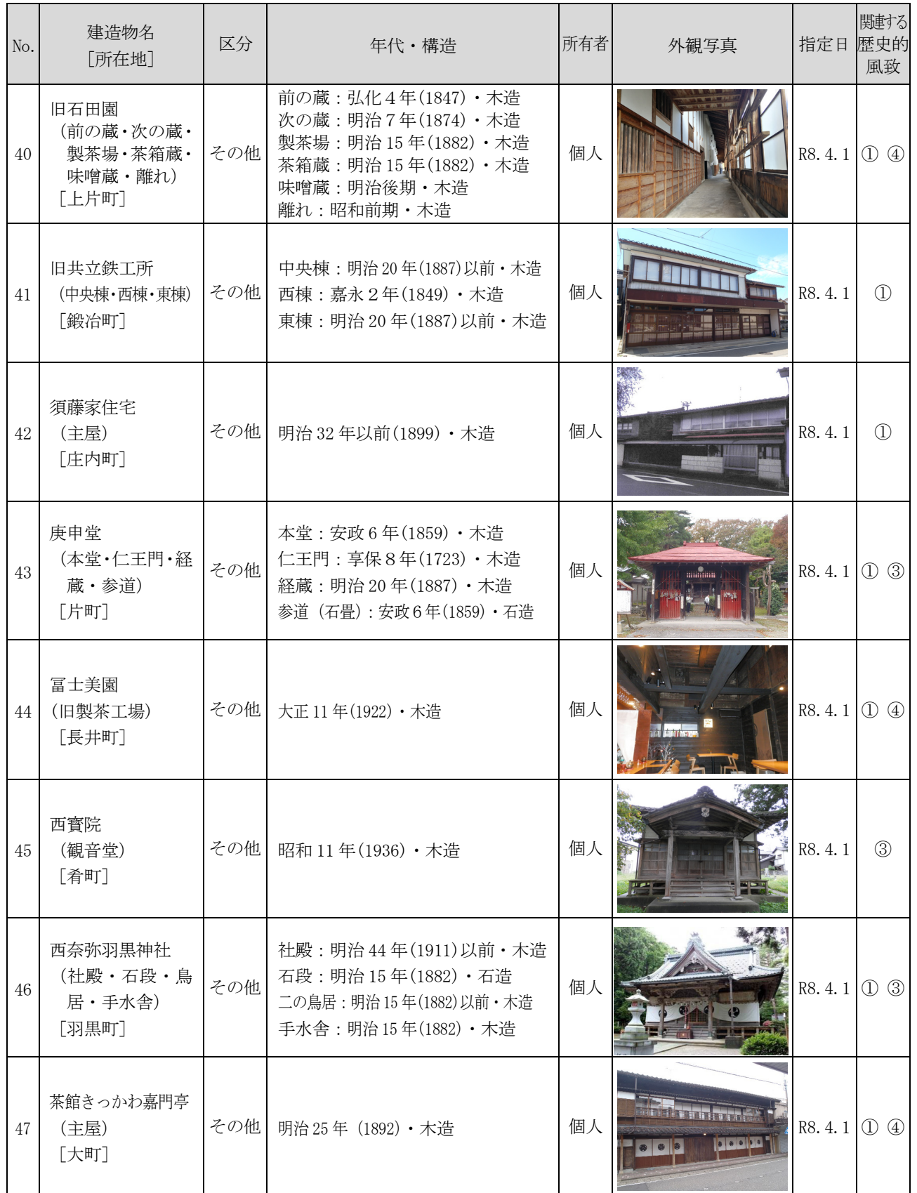
表 歴史的風致形成建造物の指定候補

※関連する歴史的風致 ①：村 upper 城下の祭礼にみる歴史的風致 ②：種川の制など鮭文化にみる歴史的風致 ③：村 upper 城下の木と漆の匠にみる歴史的風致 ④：北限の茶処にみる歴史的風致