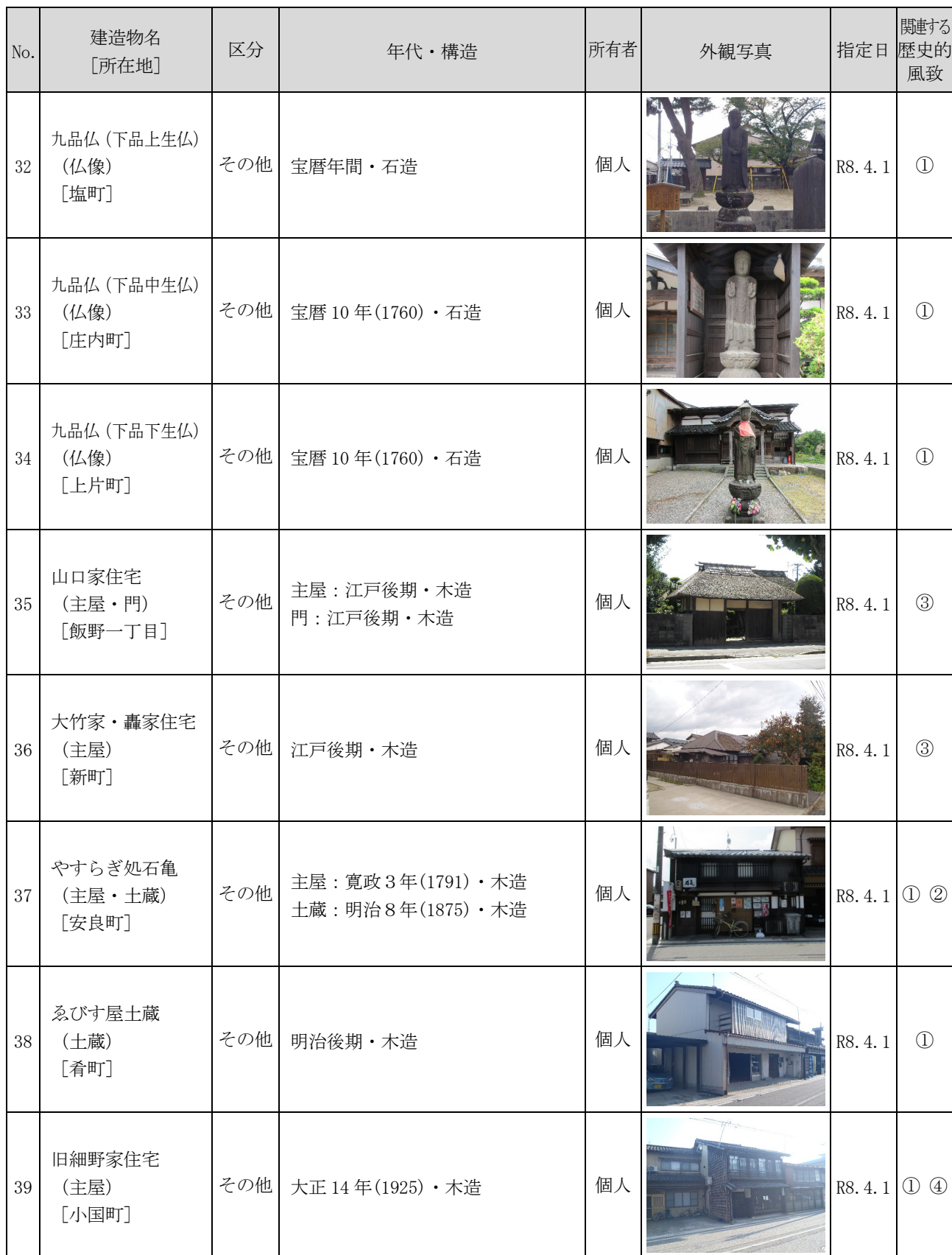
表 歴史的風致形成建造物の指定候補

※関連する歴史的風致 ①：村上天下の祭りにみる歴史的風致 ②：種川の制など鮭文化にみる歴史的風致 ③：村上天下の木と漆の匠にみる歴史的風致 ④：北限の茶処にみる歴史的風致