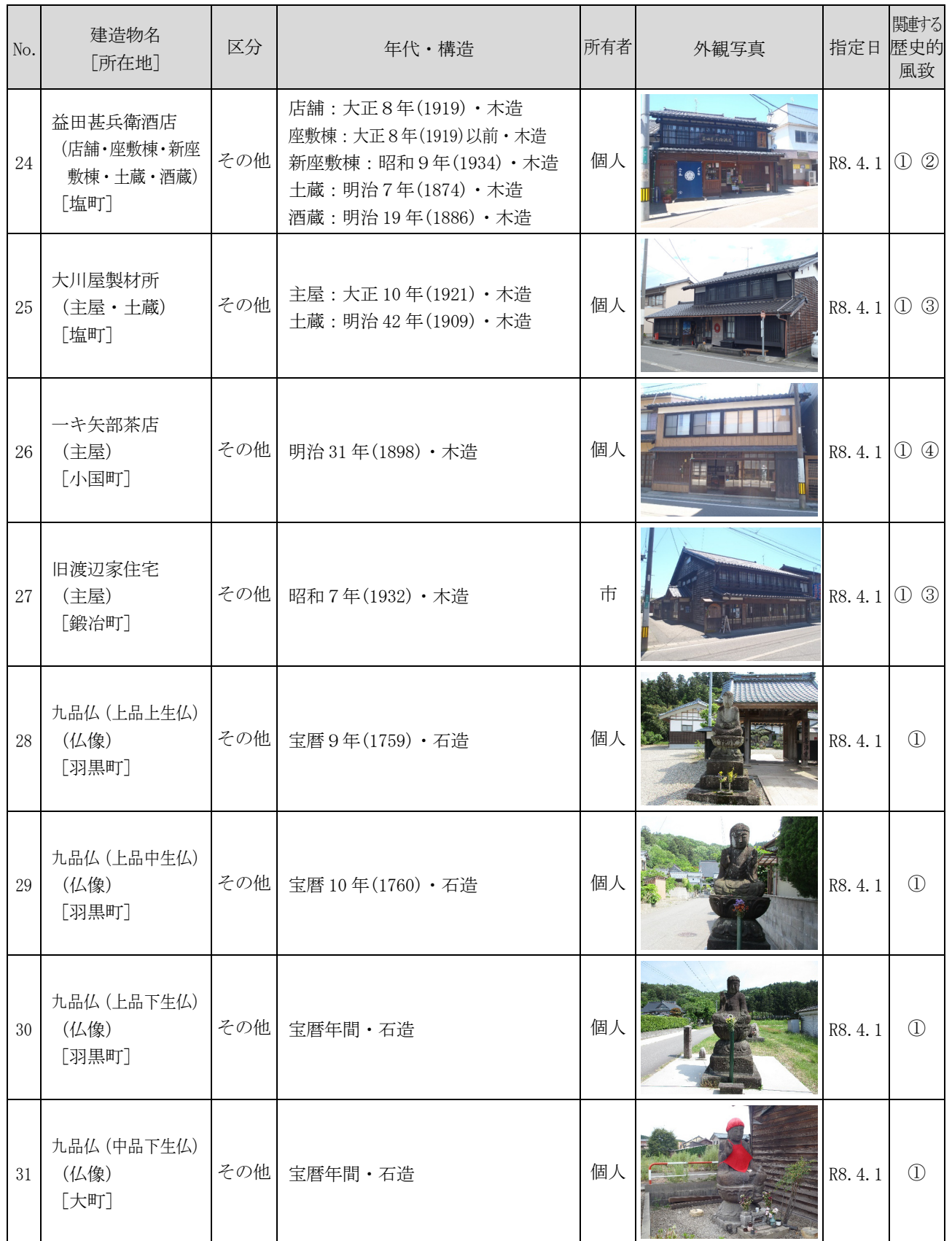
表 歴史的風致形成建造物の指定候補

※関連する歴史的風致 ①：村上天下の祭礼にみる歴史的風致 ②：種川の制など鮭文化にみる歴史的風致 ③：村上天下の木と漆の匠にみる歴史的風致 ④：北限の茶処にみる歴史的風致