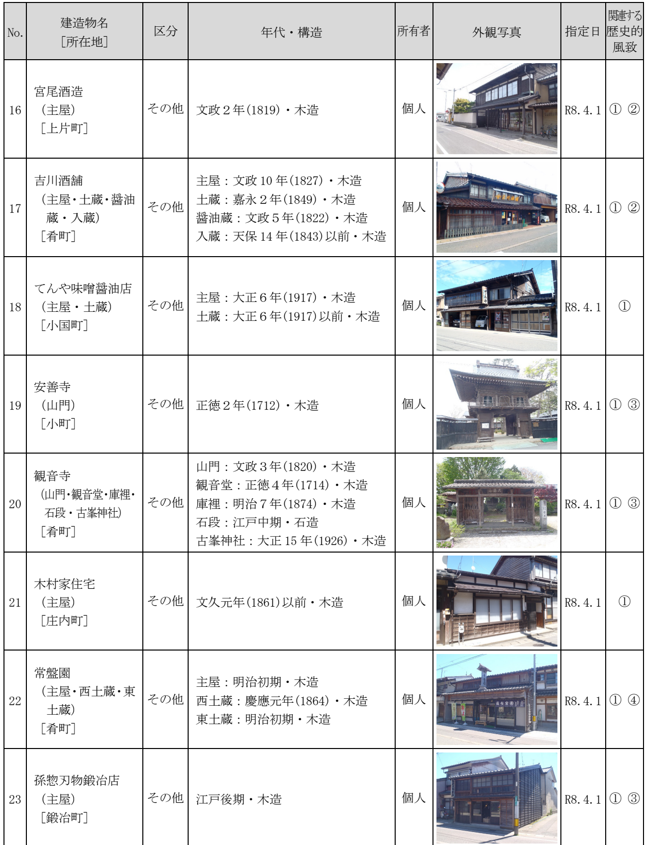
表 歴史的風致形成建造物の指定候補

※関連する歴史的風致 ①：村上城下の祭礼にみる歴史的風致 ②：種川の制など鮭文化にみる歴史的風致 ③：村上城下の木と漆の匠にみる歴史的風致 ④：北限の茶処にみる歴史的風致