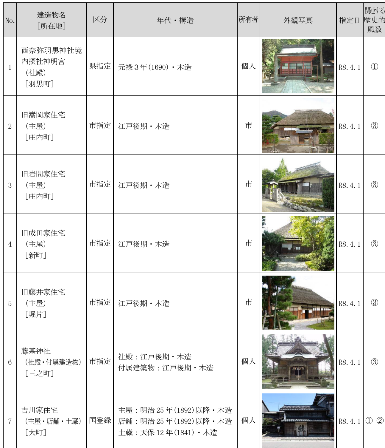
表 歴史的風致形成建造物の指定候補

※関連する歴史的風致 ①：村上城下の祭礼にみる歴史的風致 ②：種川の制など鮭文化にみる歴史的風致 ③：村上城下の木と漆の匠にみる歴史的風致 ④：北限の茶処にみる歴史的風致