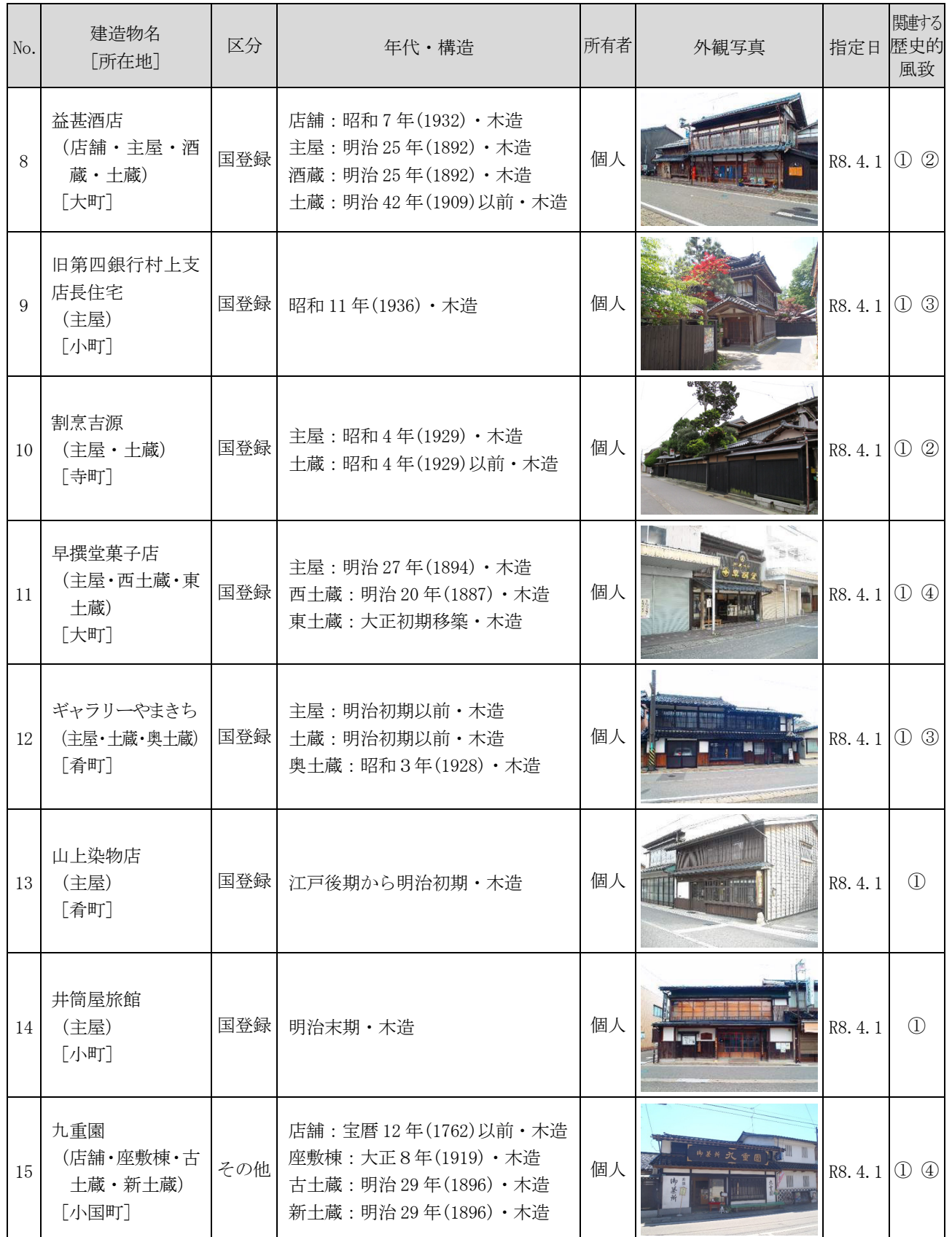
表 歴史的風致形成建造物の指定候補

※関連する歴史的風致 ①：村 upper 城下の祭礼にみる歴史的風致 ②：種川の制など鮭文化にみる歴史的風致 ③：村 upper 城下の木と漆の匠にみる歴史的風致 ④：北限の茶処にみる歴史的風致