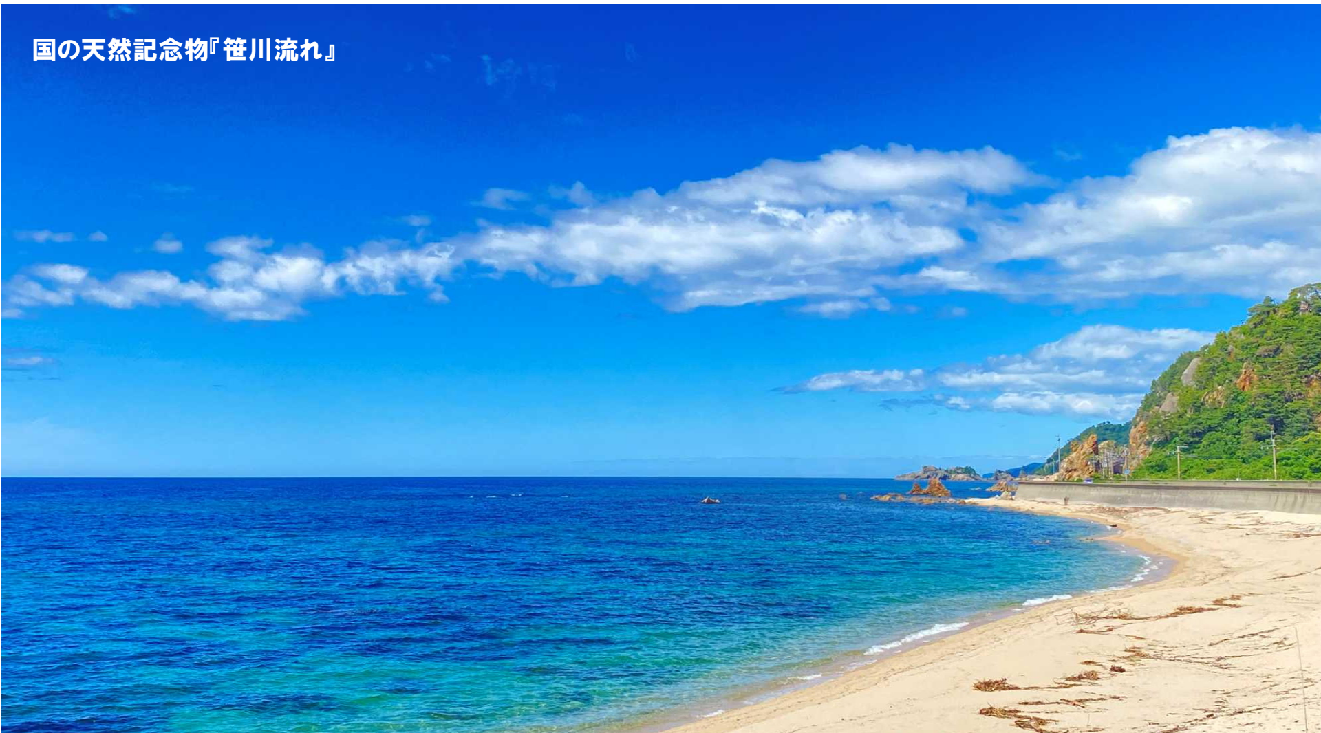
国の天然記念物『笹川流れ』

一度、村上高等学校の魅力や様子、住まいの雰囲気や村上の地域と環境を直接肌身で体感してみませんか。