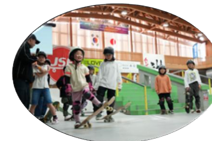
ブルボンスケートパーク村上