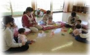
同じくらいの月齢の赤ちゃんを囲んで ママたちのおしゃべり