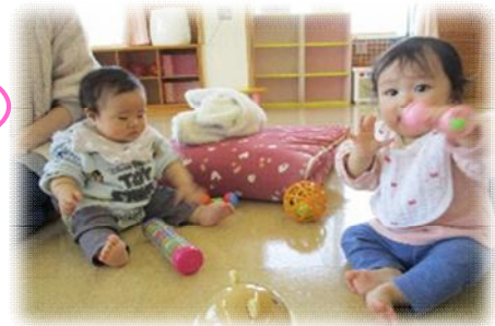
赤ちゃんたちはキョロキョロ👁️👁️ 可愛いね♡