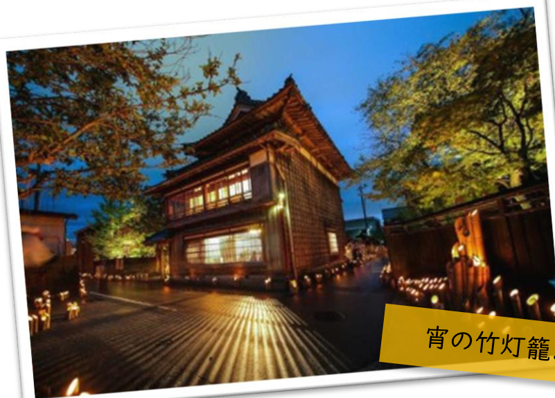
宵の竹灯籠まつり

江戸時代から続く「てんや味噌醤油店」で造られる醤油は、木桶で2年間熟成された天然発酵仕立て。まろやかさと甘味があり、その中にある旨みが特長です。味噌も同じく木桶にて1年間の天然発酵で丁寧な造られ深みのある味わいとなっております。