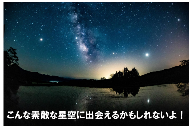
こんな素敵な星空に出会えるかもしれないよ！