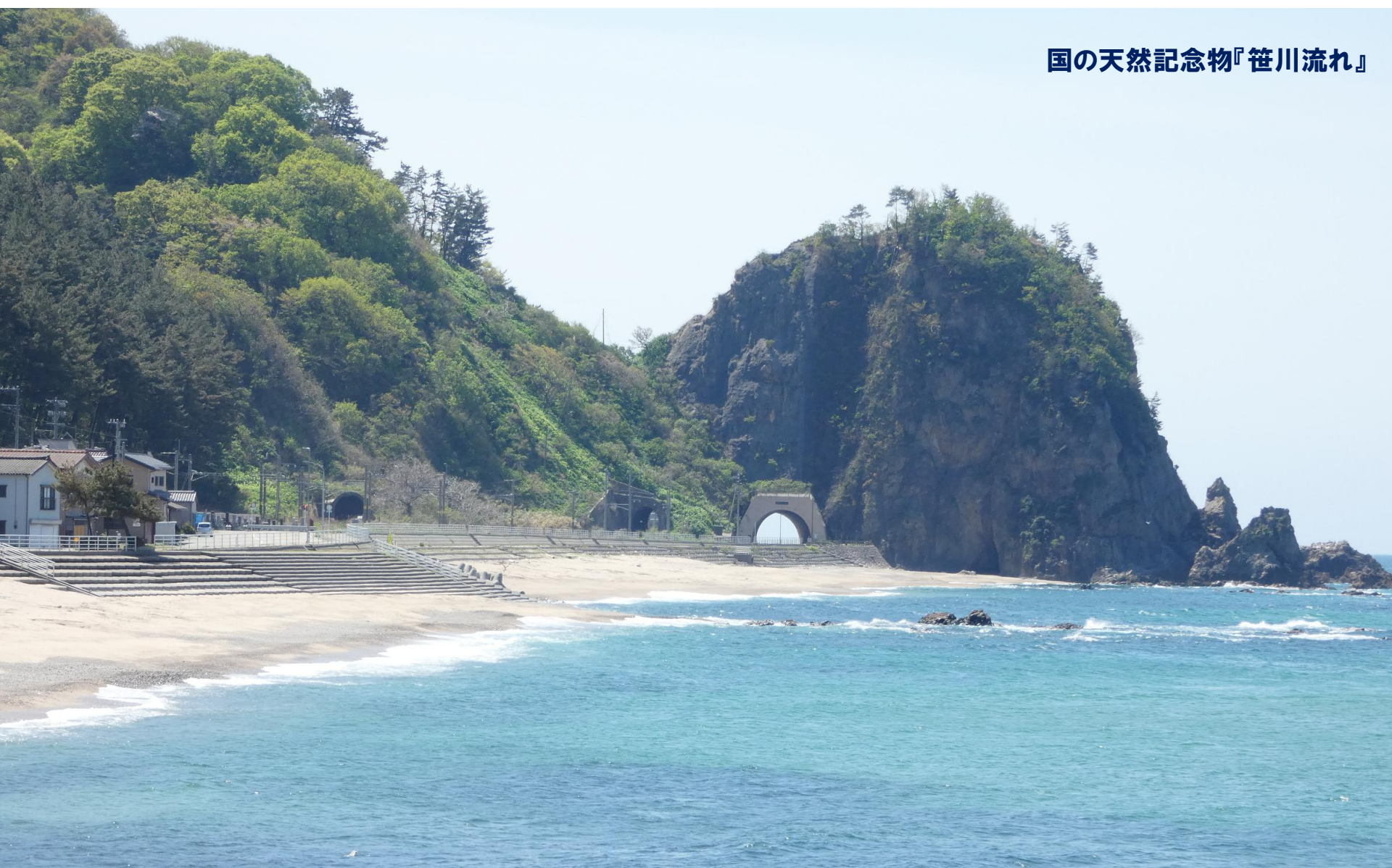
国の天然記念物『笹川流れ』

新潟県村上市では、県外在住の生徒を「村上高等学校」において入学から卒業までの3年間受け入れる地域みらい留学を実施しています。