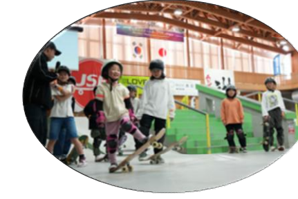
ブルボンスケートパーク村上