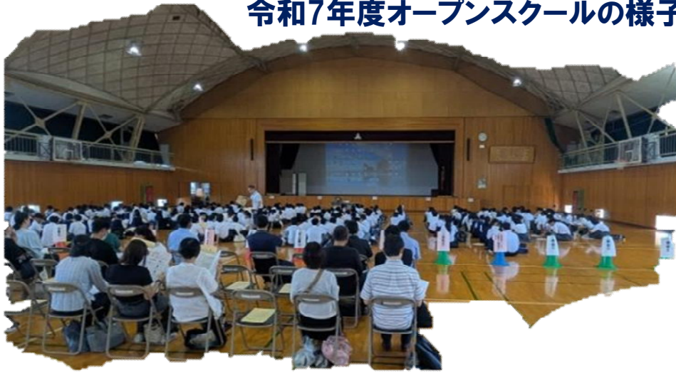
令和7年度オープンスクールの様子