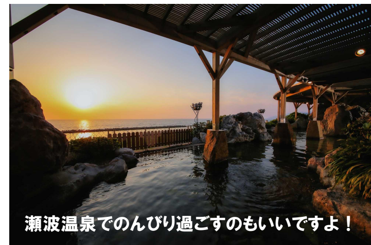
瀬波温泉でのんびり過ごすのもいいですよ！