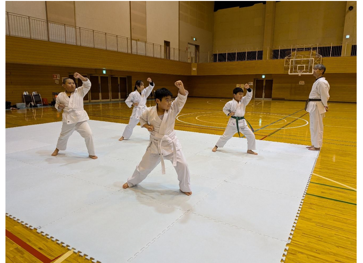
空手スポーツ少年団