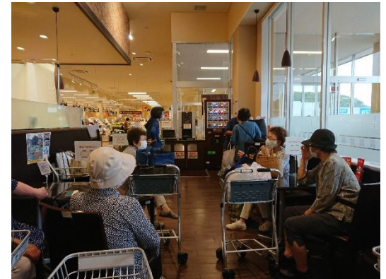
買い物の後の一息、おしゃべりタイム

参加者：14名 全員運転できる人 将来、運転免許返納した時、こんな買い物支援のバスがあれば助かると思い参加した方がほとんど