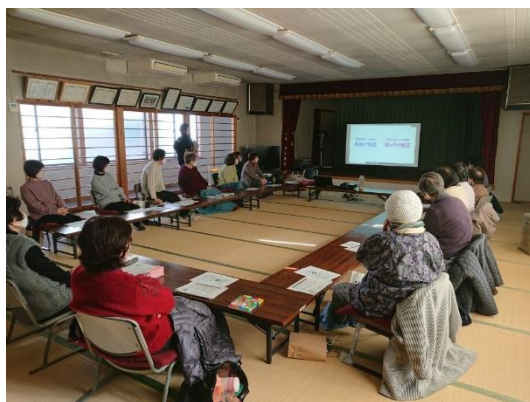
吉浦地域の茶の間出前講座