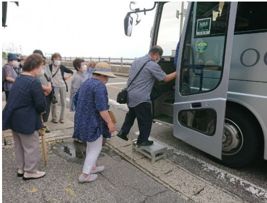
集落センターからバスに乗ります。

上海府地区 馬下集落 買い物ツアー （まち協 高齢者生活支援事業） 馬下集落をモデル地区として実証実験 6月24日