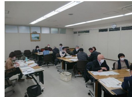
グループ検討の様子

12月 6日 互近所ささえ～る隊会議（第3回） 12月までの活動について報告 おたがいさまだねっか講座の振り返り 今後につながる取組みについて