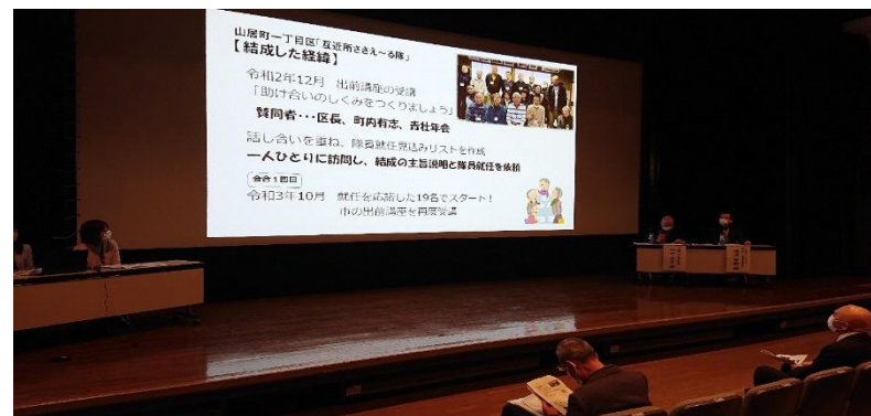
村上地区区長会新年研修会でのPR