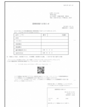
▲資格情報のお知らせ