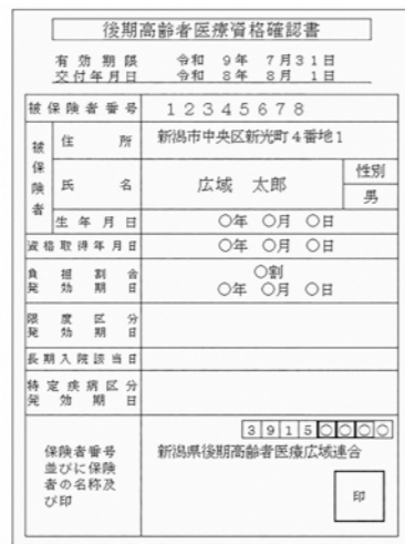
▲後期高齢者医療資格確認書（ベージュ色）