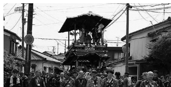
▲修繕が完了し輝くおしゃぎりを曳く

大工町の祭屋台修繕完了を記念して行われた特別巡行。令和元年の村上大祭から7年ぶりのお披露目となりました。夏を思わせる強い日差しの中、多くの町内から参加者が集まり、修繕により輝きを増した豪華賢覧なおしゃぎりの曳き廻し。お囃子や甚句の音とともに、町中祝賀の雰囲気 ほやし に包まれ、本祭りに向けて気持ちが高まる1日となりました。