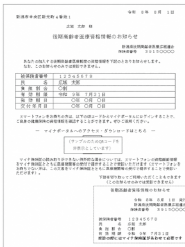
▲後期高齢者医療資格情報のお知らせ

「資格確認書（ベージュ色）」「資格情報のお知らせ」は、7月中旬に発送します。「資格確認書（ベージュ色）」は、8月1日(土)から使うことができます。「資格情報のお知らせ」が交付された人は引き続きマイナ保険証を利用してください。