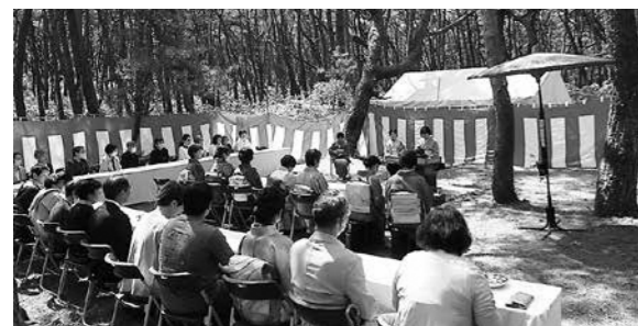
▲晴天に恵まれた野だての茶会