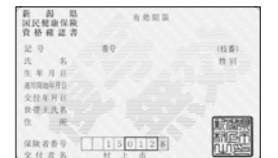
▲資格確認書（色：空色）