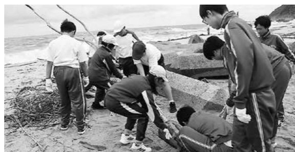
▲大きなゴミも協力して回収

流木や海藻の量が多く、回収用の大きな袋はすぐにいっぱいになり、海岸は見違えるほどきれいになりました。生徒と児童は「海を訪れる人を思い作業することで、訪れた人も作業した人の心もきれいになる」「みんなで力を合わせてきれいにして良かった」と振り返っていました。