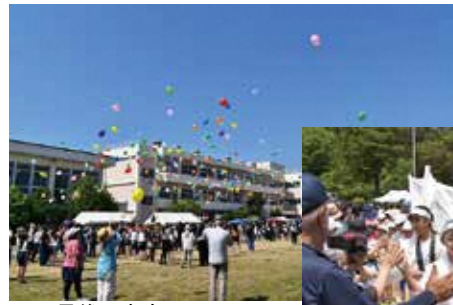
▲最後の青空の下で

5/16・30 刻む両校の歴史、完全燃焼のラストステージ 小川小学校、朝日みどり小学校閉校記念大運動会