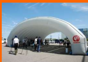
災害用大型テント