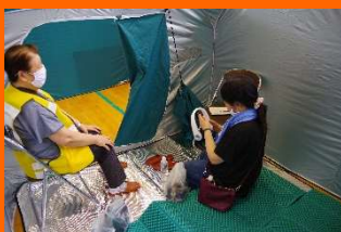
避難所体験コーナー