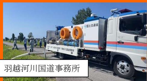
羽越河川国道事務所