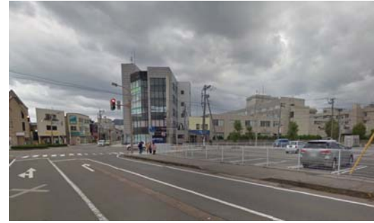
駅前交差点と病院・駐車場