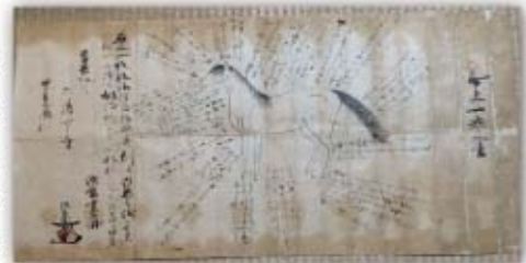
献上一卷之書(慶長11年)

の運搬に多くの馬が必要だったこともあり牧場があったのではないかというお話でした。また殿様に献上する馬の条件が書かれた文書も残っており、 牧場で飼育された馬が献上もされたようです。京都・大阪までの道中、行きは馬が狼に襲われないよう松明をかざして運