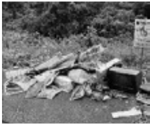
市内でも心無い人たちによる不法投棄が後を断ちません

1人で不法投棄者に注意すること、やめさせようと行動することは危険です。不法投棄の現場を目撃した場合は、投棄者を特定できる車両の特徴(車種、ナンバー)や時間、場所などを最寄りの警察または市役所へ通報してください。