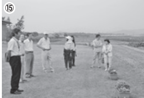
⑪⑫おいしくてヘルシーな手作り弁当で食生活改善推進員の皆さんと会食(総合文化会館) ⑬10か月児健康相談にきたお母さんとお話(朝日保健センター) ⑭地域の茶の間従事者研修会で講演(朝日保健センター) ⑮朝日まほろば夢農園を視察(朝日みどりの里)