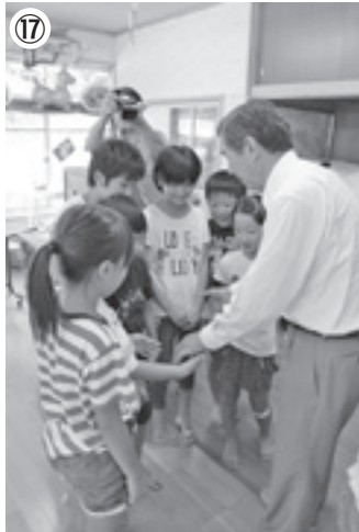
⑯子ども昔語りの披露 ⑰子どもたちとふれあいく山北やまゆり学童保育所 ⑱中学生の部活動を視察(山北中学校) ⑲⑳加工所、直売所を視察(名水の里おおごと)