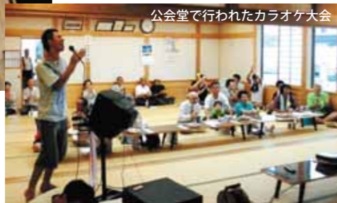
公会堂で行われたカラオケ大会

去る8月15日に、夏のイベントとしてカラオケ&豊年おどりが開催されました。ウーファの重低音と大音量に体が動き、100インチの大画面映像に心までくぎづけにされ、歌い手は勿論、観客にも感動が伝わって来ました。今年