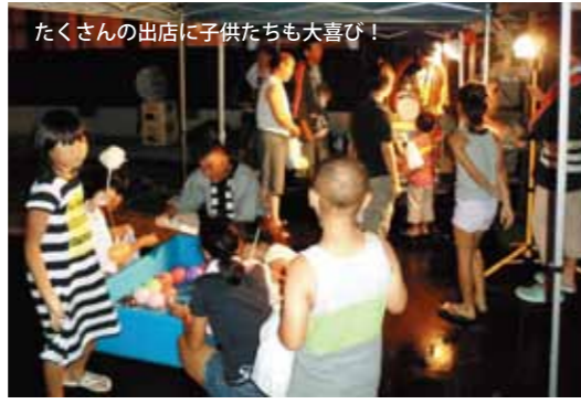
たくさんの出店に子供たちも大喜び！