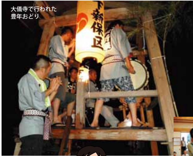
大儀寺で行われた豊年おどり