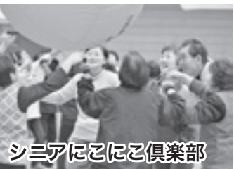
シニアにこにこ倶楽部

○集落・団体への出張健康講座 講座の依頼が増えています。未だ講 座を開催して いることが分 らない人も います。