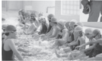
ジュニア水泳教室