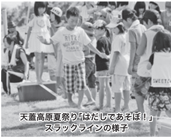
天蓋高原夏祭り「はだしであそぼ！」 スラックラインの様子