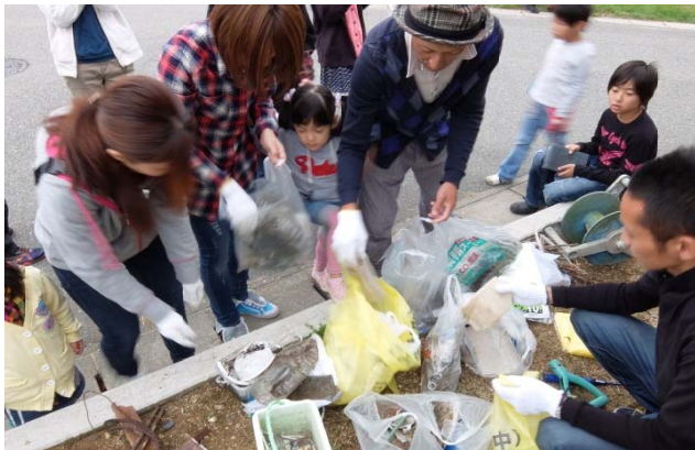
集められたごみの分別の様子