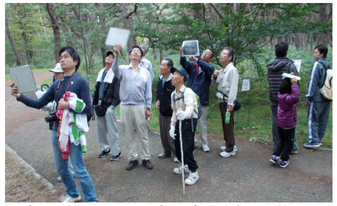
写真の風景と同じアングルを探す参加した皆さん