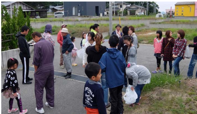
初めての環境整備活動に集まった皆さん

区民 39 人 (うちお子さん 15 人) が参加し、区としては初めての環境整備活動を行いました。