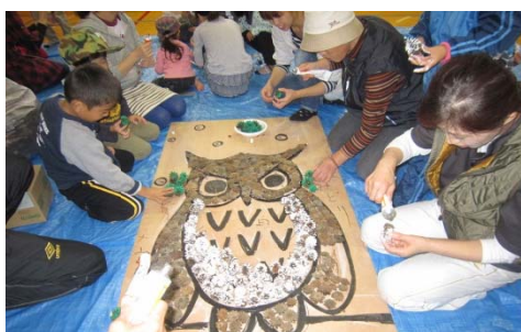
オブジェ作りの様子