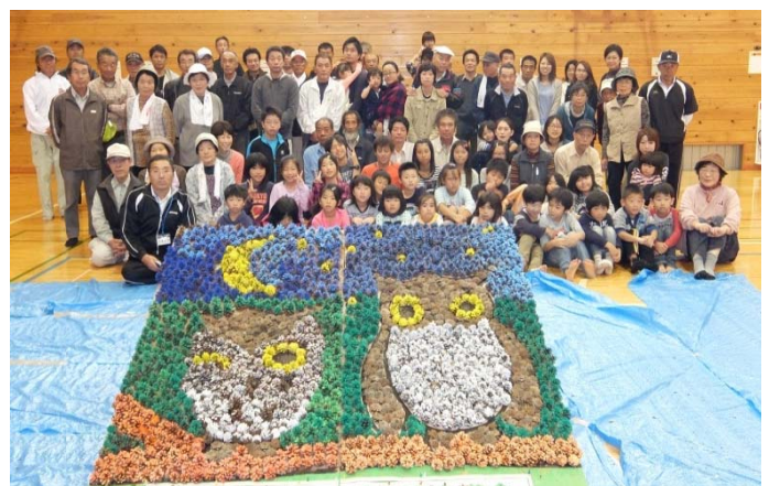
完成したオブジェと作成した皆さん