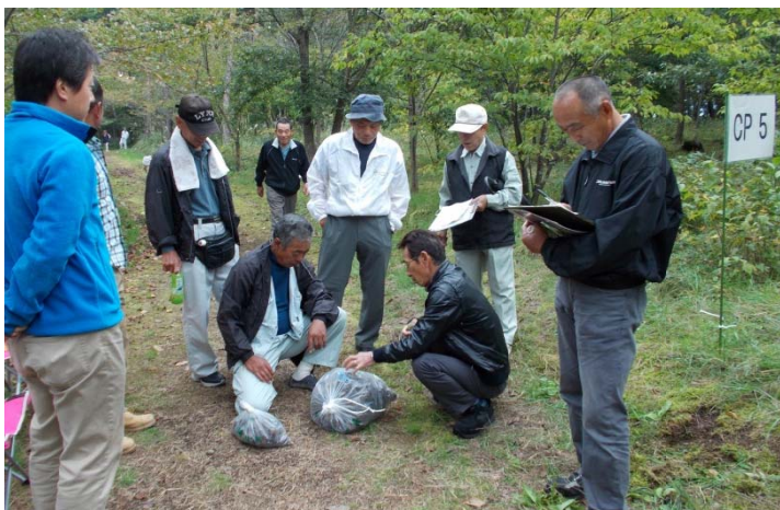
松ぼっくりの数を見極める参加者の様子

10月13日にワクワクお幕場ウォーキングが開催されました。今年は、松林の中にある物を利用して楽しもうと、袋に入った松ぼっくりの重さや数当て、それに風景のアングル探しなどで、1時間ほどウォーキングした後、松ぼっくりでフクロウをモチーフにしたオブジェを、参加者全員で作りました。