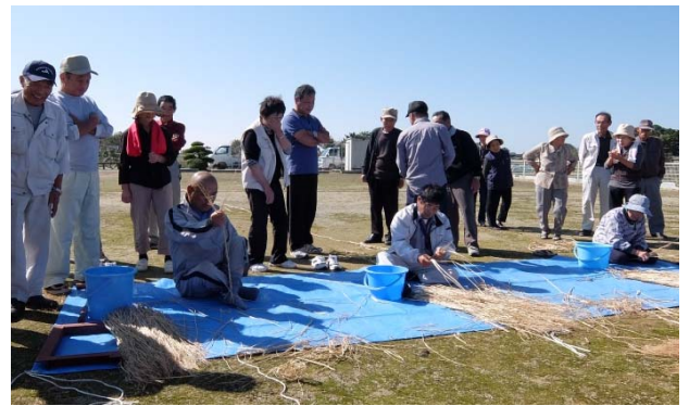
伝統のなわ縫いリレーの様子

第9回となる今年は、農村公園で秋晴れの下 200 人以上が集まり、午前中は集落を 3 組に分けた競技会、午後からカラオケなどで楽しく交流を深め、笑い声が飛び交っていました。