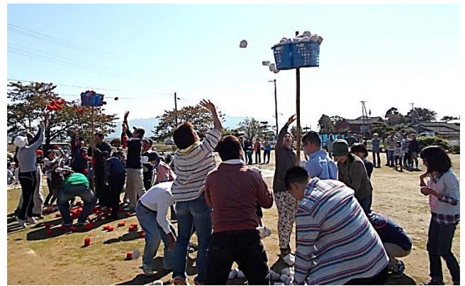
玉入れ競技の様子