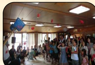
屋内での玉入れは、迫力満点

昨年のふれあい大会は、100 人近く例年より多く集まり、集落の皆さんが楽しんでくれました。30℃以上の日が続いたため、公民館の中で行いましたが、せっかくの区民ふれあい大会なので、今年は公園で賑やかにやりたいと思います。