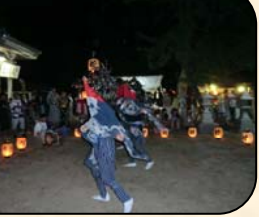
諏訪大神社の祭り 8/26