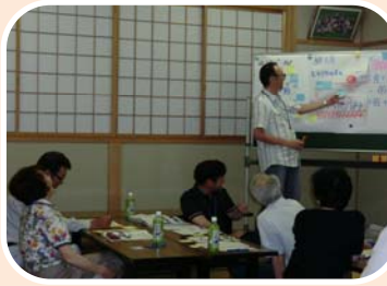
花植栽のイメージづくり 7/24