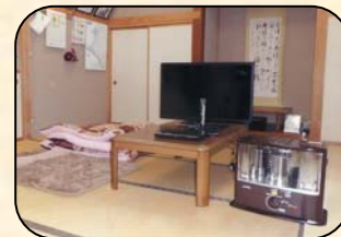
しゃべり場づくりとして整備した備品