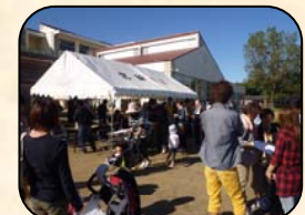
イベントに集まった皆さん