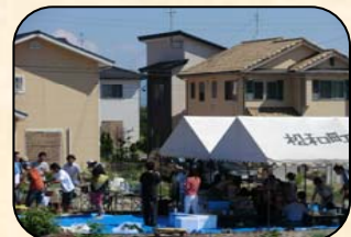
会場は区のみんち、テントは松和町から