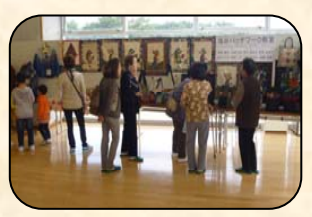
作品展観覧者の皆さん 10/20・21