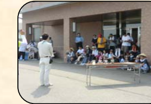
健康ウォークで下水道施設見学 7/29