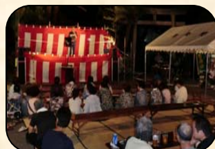
盆踊り前のカラオケ大会の様子