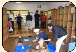
収穫感謝祭での餅つき 11/23

昨年は子供達全員のユニフォームを作り、伝統行事継承の意気込みを深め、一層賑やかに行いました。