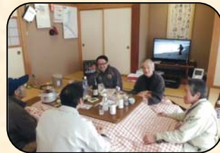
しゃべりの場の様子

2 月の外は、雪景色。こんな時は温かいこたつに入って、飲むほどに自然と口も滑らかになり始め、カラオケも始まり大変和やかな交流となっていました。今後も、この様な機会を大切に、集落のさまざまなことの発信の「港」にしたいと思っています。