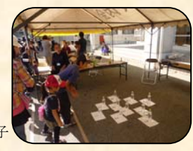
テント村での輪投げの様子