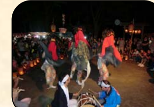
法徳寺の観音様祭り 8/17