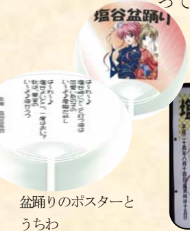
盆踊りのポスターと うちわ