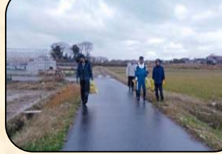
年 3 回行う空き缶拾いと側溝掃除