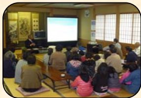
自主防災会の勉強会 11/23