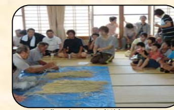
一番盛り上がった縄織りリレー