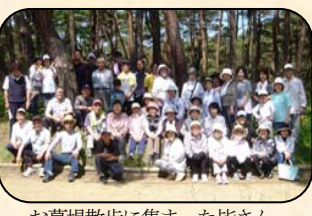
お幕場散歩に集まった皆さん

塩谷では、3 年前から取り組んでいる三つの事業をそのまま「まちづくり」として実施しています。三つの事業は、お互いをもっと知り合う、元気を出そうがテーマです。「お幕場散歩」は月 1 回（5 月～11 月）歩きながら、おしゃべりを楽しみます。盆踊りは 40 年ぶりに復活できました。区民作品展では、日頃の精進の成果を出し合っています。