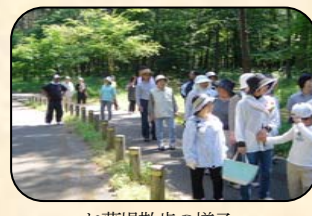
お幕場散歩の様子