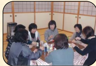
しゃべりの場の様子