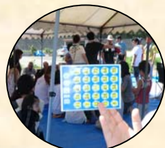
ビンゴゲームの始まりです