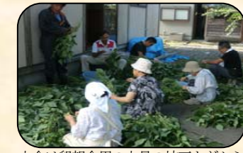
大会は懇親会用の大量の枝豆もぎから