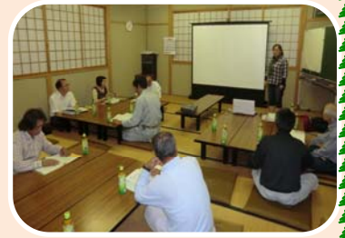
講師を招いての勉強会 10/11