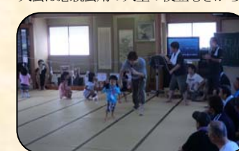
かわいいお子さんのパン食い競争