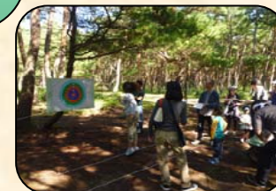
ダーツゲームの様子