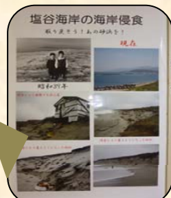
浸食される前の塩谷海岸の 写真も展示