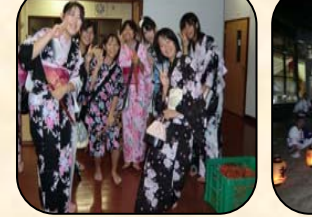
お雑子担当のみなさん 8/26