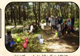
松ぼっくり投げの様子