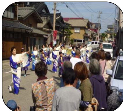
町屋を練り歩く踊りと見学者