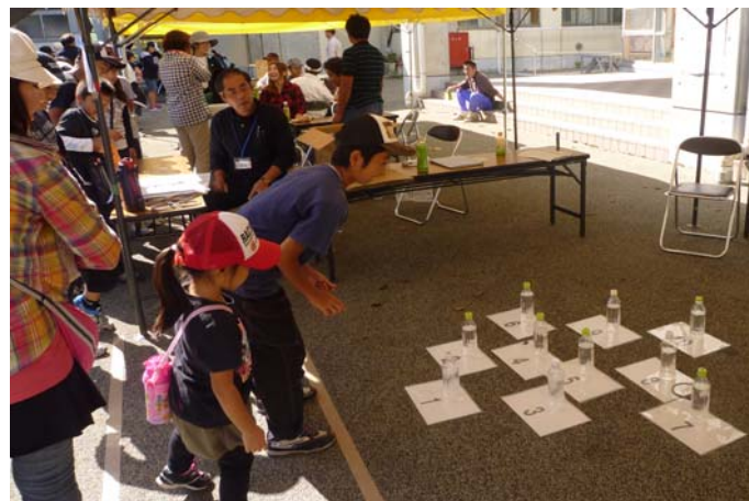
テント村での輪投げ