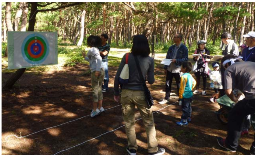
松林の中でのダーツゲーム