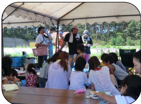
赤松区親睦会 ビンゴゲームの様子

赤松区は、平成20年3月にできた子供たちがたくさんいる新しい集落です。現在24世帯、74人が暮しています。「市民協働のまちづくり」が始まったことをきっかけに初めて「地区親睦会」開きました。