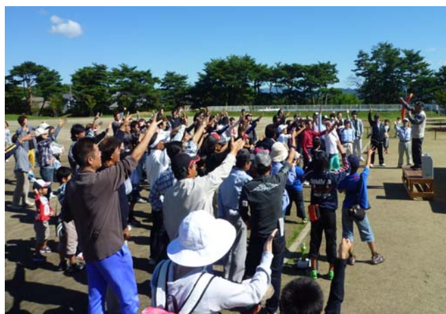
最後はみんなでジャンケン大会