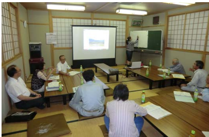
第4回花いっぱい事業検討部会の様子

花いっぱい事業検討部会は第4回の部会を開きました。仕事を終わってからみなさんと話し合いながら、一歩ずつ具体化して言っています。