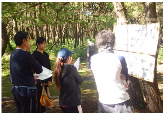
チェックポイントでのクイズ