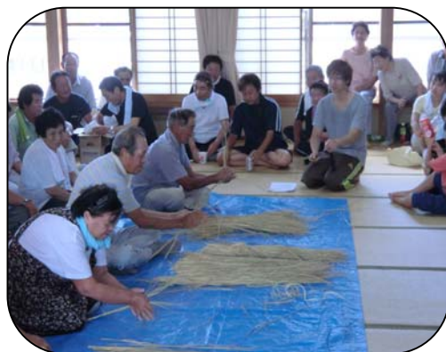
大会のメインイベント、縄縫い競争 今年は緑チームが23.2メートルで1位になりました。