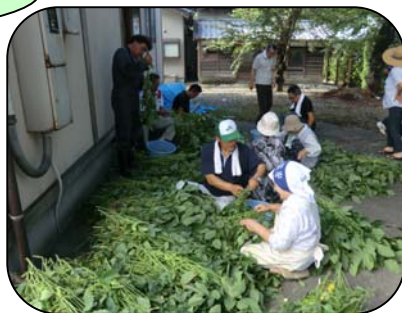
大量の枝豆！これは懇親会用です

昨年は100人ほどの参加でしたが、170人近くが集まり半日を笑顔でふれあいました。