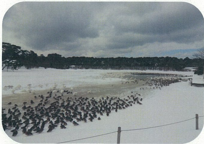
2月3日の大池。寒波で一部を除いて、雪に覆われました。