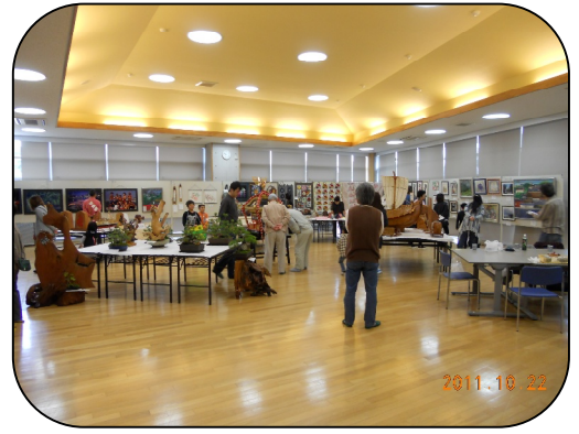
砂山小学校で開催された展示会場の全景

新潟地震や60年前の御輿の写真、昔のものがあり、時代を感じさせられます。」と、観覧していました。