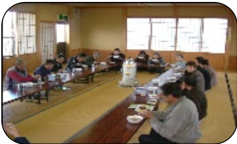
出来たての地元の食材の料理をみなさんで