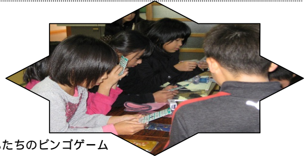
子どもたちのピンゴゲーム