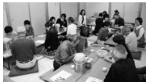
昨年の村上茶ムリエ講座