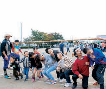
神納東ふれあい運動会

神納東地域まちづくり協議会では、「心やさしく安全に暮らせる神納東 ～笑顔があふれる集落・地域を目指して～」の基本理念のもと、各種事業に取り組んでいます。