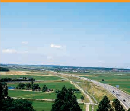
山元遺跡からの眺め

今後も活気と魅力あふれる住みよいまちづくりのため、各種事業に取り組んでまいります。