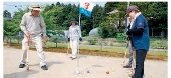
グランドゴルフで健康づくり 上助淵集落

山屋集落では、毎年さつき園とやまゆり荘・やまやの里の盆踊り大会に出演し、盆唄を披露しています。7月30日(木)にはやまゆり荘・やまやの里納涼盆踊り大会が行われ、子どもたちが笛・太鼓を立派に披露しました。集落の皆さんが大切にしている盆唄が、しっかりと受け継がれています。