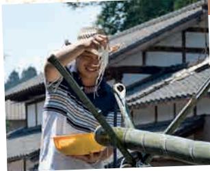
イベントテントで集落行事の充実を 里本庄集落

里本庄集落では、集落行事をさらに快適で充実したものにするため、大型のイベントテントを購入しました。8月2日(日)には、新しいテントを活用して、子ども会の行事が行われました。お父さんたちが暑い中苦労して準備した流しそうめんが好評でした。