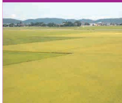
瑞穂大橋からの風景

地域全体では、夕涼み会を8月に開催したほか、これからミニ体育祭や冬のイベントを行う予定です。また、今年度より地域の活性化を目的とし、幅広い年代の方や他団体との意見交換会を実施する予定です。