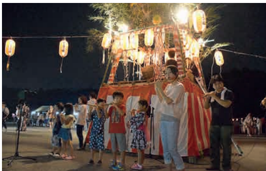
やまゆり荘納涼盆踊り大会に出演 山屋集落

神納東小学校に植えたシバザクラの草取りを、地域ボランティアを募り行いました。親子連れを中心に約80名の方に参加いただきました。草取り終了後は、参加者に花の種を配り、花いっぱいの地域を呼びかけました。