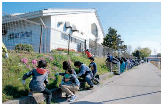
花いっぱいプロジェクト

里本庄集落では、集落行事をさらに快適で充実したものにするため、大型のイベントテントを購入しました。8月2日(日)には、新しいテントを活用して、子ども会の行事が行われました。お父さんたちが暑い中苦労して準備した流しそうめんが好評でした。