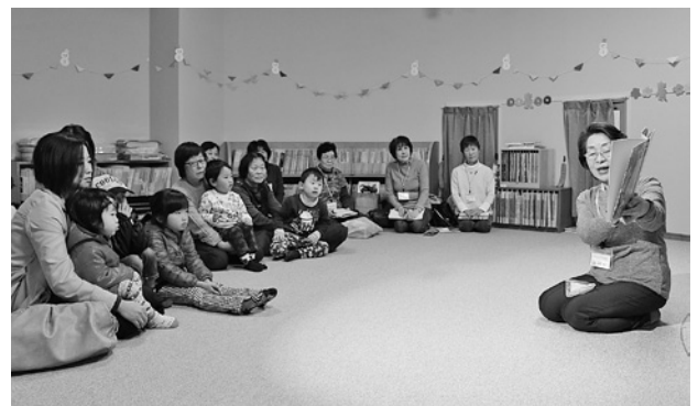
中央図書館でのよみきかせ