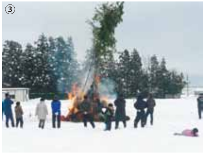
①古波路集落 ②小揚集落 ③三川集落