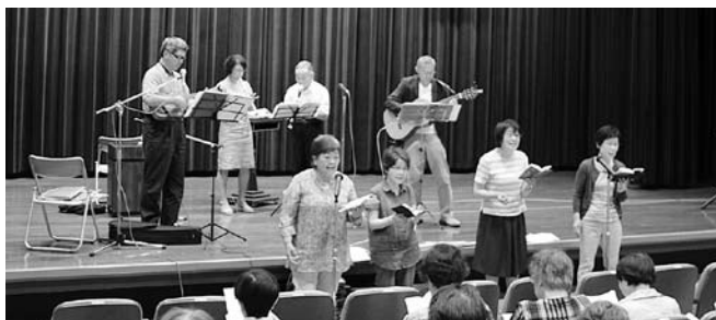
昨年の歌声・村上

☎ 国土交通省北陸信越運輸局新潟運輸支局 (「不正改造車・黒煙110番」 ☎025-285-3125)