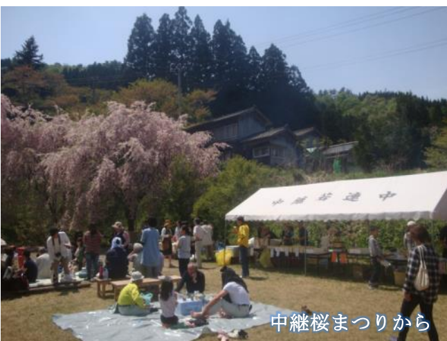
中継桜まつりから