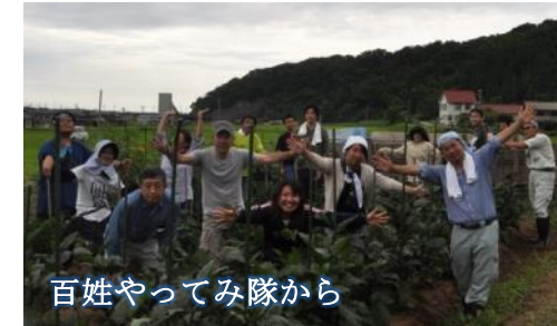
百姓やってみ隊から