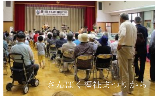
さんぽく福祉まつりから