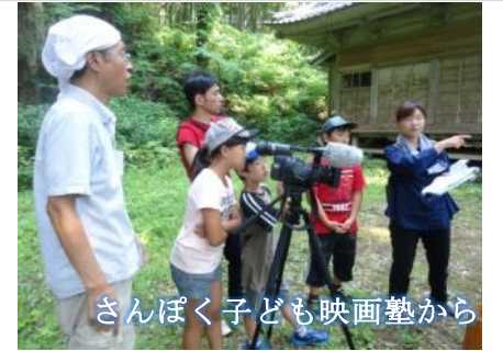
さんぽく子ども映画塾から