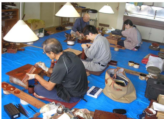
右 職業訓練 風景