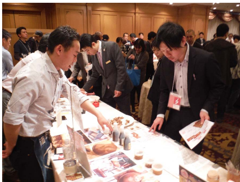
村上食材プレゼンテーション 風景