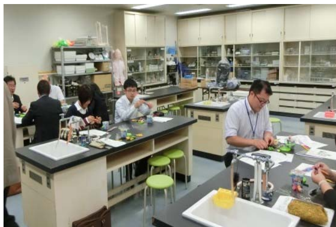
教職員研修事業 風景