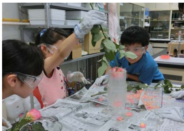
学習支援事業（科学実験）風景