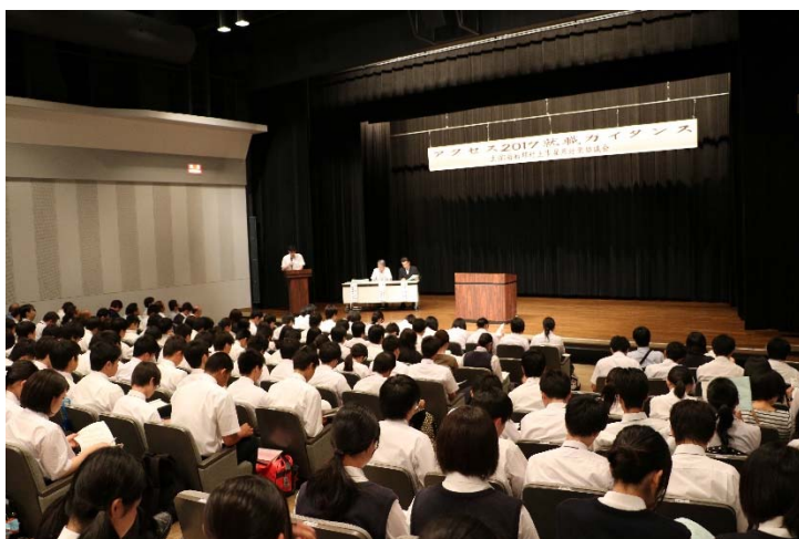
左 高校生を対象とした就職ガイダンス 風景