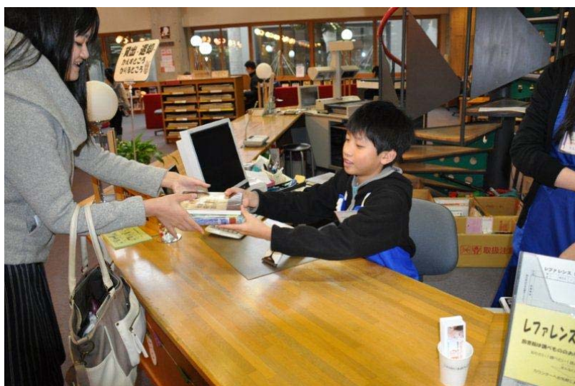
図書館職員一日体験 風景