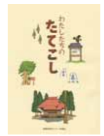
昨年度作成した冊子 「わたしたちのたてこし」

また秋には、「あさひまつり」が復活することとなり、他のまちづくり協議会とともに参加する予定となっております。