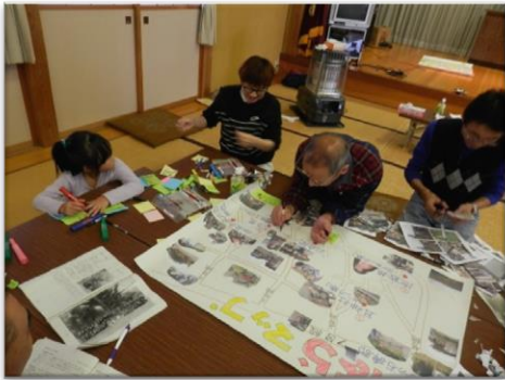
(昨年の桧原集落マップづくりの様子)