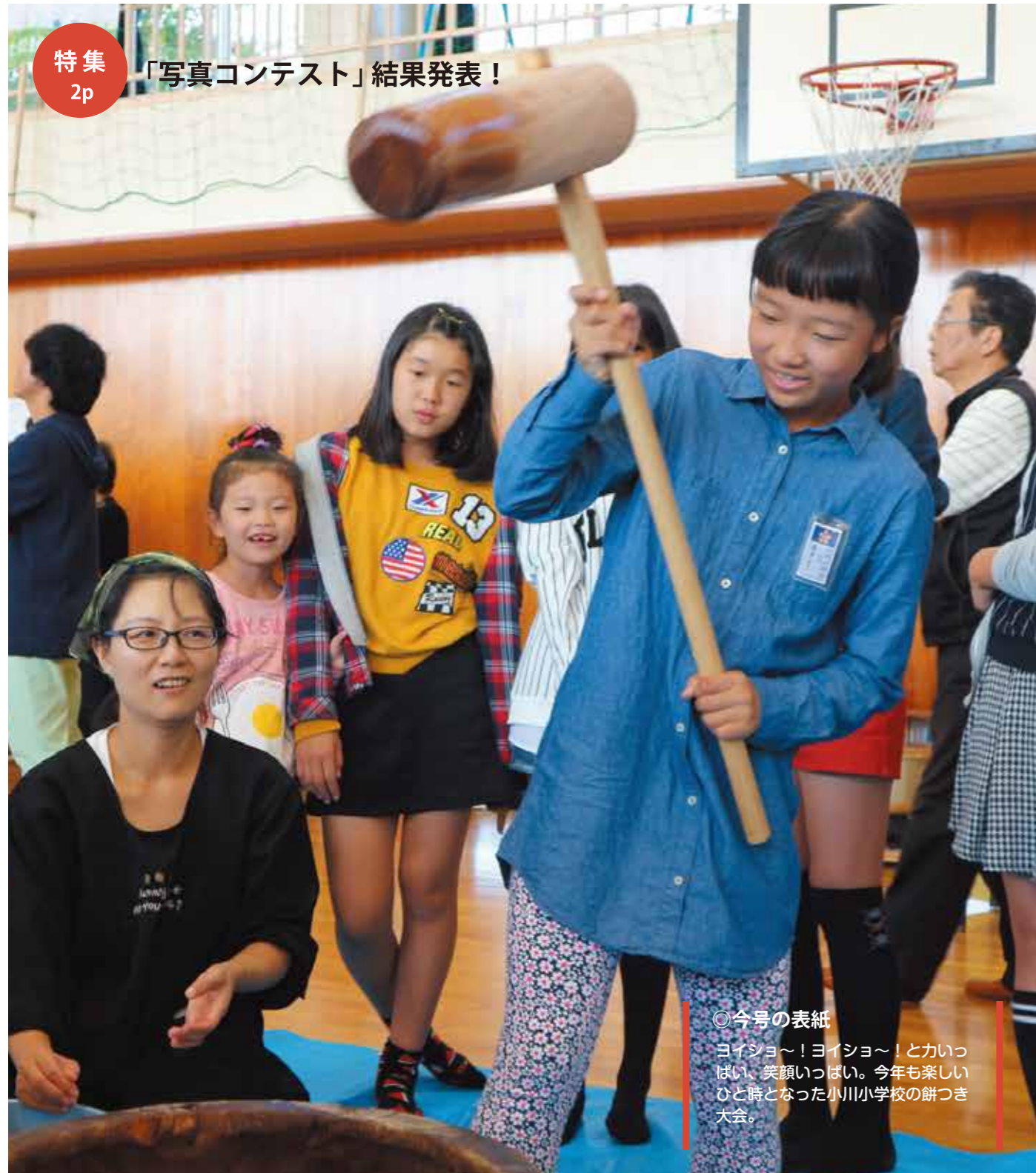
◎今号の表紙 ヨイショ〜！ヨイショ〜！と叫び、笑顔いっぱい。今年も楽しいひと時となった小川小学校の餅つき大会。