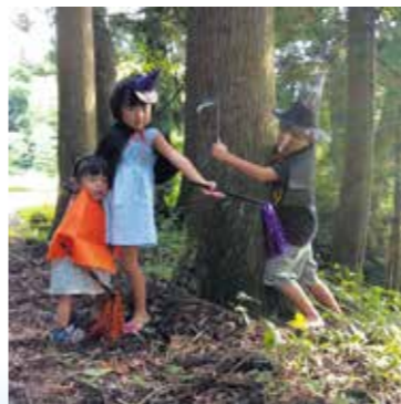
◎じゃあ、おかしをあげま賞「おかしをくれなさい!」小池業さん(瑞雲)