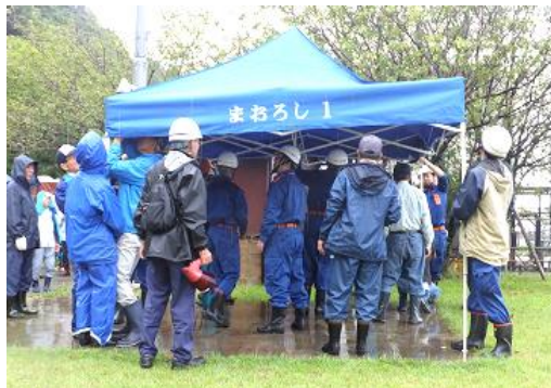
馬下集落 防災訓練 の様子