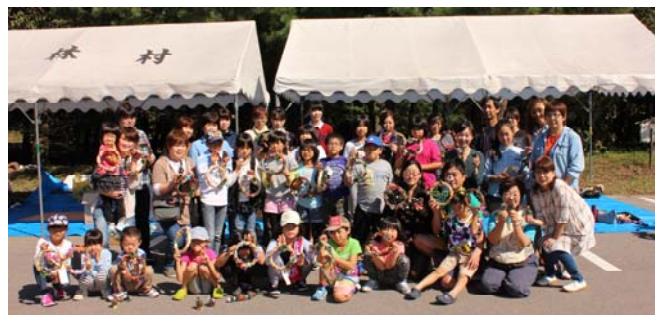
リース作りの参加者の皆さん

新潟県花いっぱいコンクール 審査員特別賞を受賞しました! あしたの新潟県を創る運動協会が主管する「第40回新潟県花いっぱいコンクール」に砂山地域の花いっぱい事業の取組みを応募し、「地域の部」で審査員特別賞を受賞しました。 これからも大池を花で飾り、砂山地域をアピールしていきましょう!