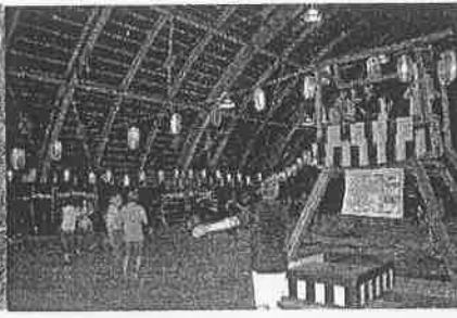
猿沢地域盆おどり大会