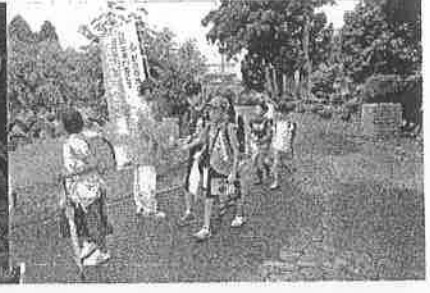
あいさつ+1（プラスワン） 運動