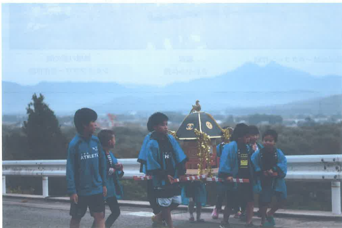
猿沢地域写真コンテスト金賞受賞作品「秋まつり」