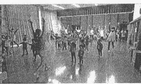
猿沢 さわやか体操