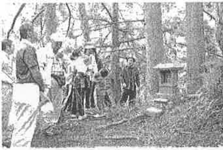
地域の魅力再発見！ 板屋越集落ウォーク