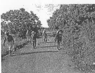
猿沢地域一斉クリーン作戦