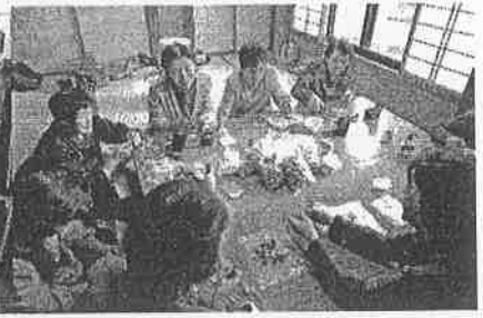
地域の茶の間 シルクフラワー製作体験