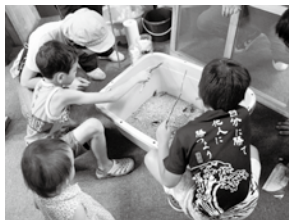
▲昨年のクワガタ釣り