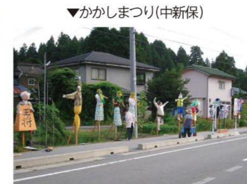
▼かかしまつり(中新保)