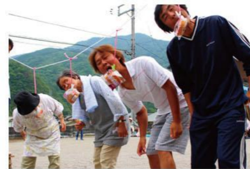
▲世代交流運動会(岩崩)