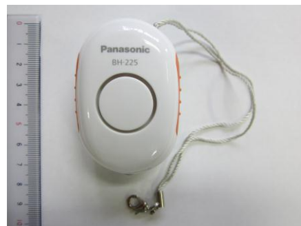
配布する防犯ブザー