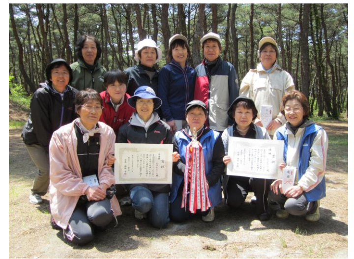
優勝した北浜町の皆さん