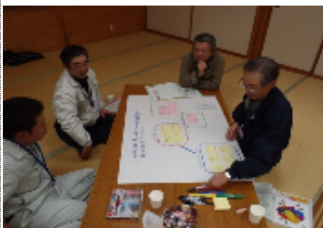
11月17日 第3回まちづくり協議会設立準備会 ~ワークショップの様子

また第3回設立準備会では「三面地域の好ましい現状と気になる現状」についてたくさんの意見を出しました。