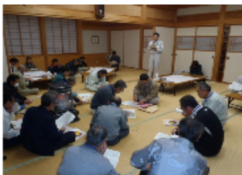
11月17日 第3回まちづくり協議会設立準備会 ~前回のふりかえり

また第3回設立準備会では「三面地域の好ましい現状と気になる現状」についてたくさんの意見を出しました。