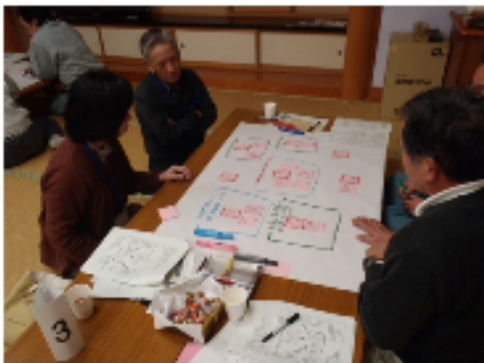
1月12日 第5回まちづくり協議会設立準備会の様子

年明け1月12日(木)に布部集落センターにおいて第5回三面地域まちづくり協議会設立準備会を開催しました。「将来像を実現するための具体策について」ワークショップを行い、委員の皆さんから多くのアイデアを出していただきました。