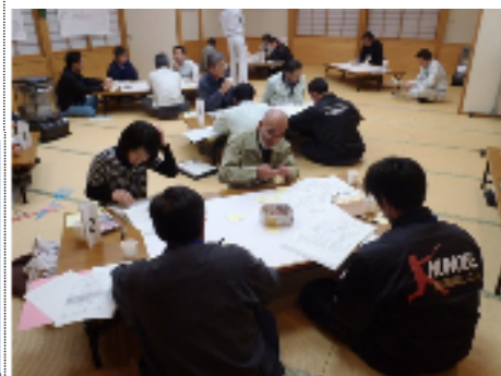
12月8日 第4回まちづくり協議会設立準備会 ~個人ワーク

前回、地域の現状を見つめ直し、浮かび上がった「好ましい現状」と「気になる現状」から、何かしら手を打てば訪れる明るい将来と成り行きで訪れるマイナスの将来を予測しました。