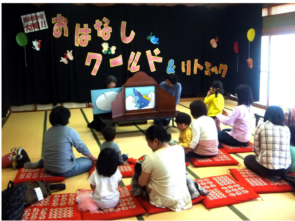
おはなしワールド

始まる前は元気いっぱいに遊んでいた子どもたちも、いざ読み聞かせの時間になると身を乗り出し、目を輝かせながらじっくりと絵本の世界に浸っていました。そんな我が子の姿を見守るお母さんたち。