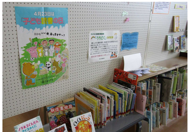
図書室では絵本をたくさん揃えています

絵本の読み聞かせは、毎月第4日曜日に荒川地区公民館で行っています。小さい子も大歓迎です、是非みなさんお越しください。