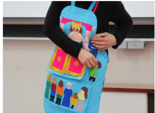
ポケットからいろいろなものが飛び出してくる!

4月22日(日)、荒川地区公民館を会場に「あらかわおはなしワールド」を開催しました。4月23日の「子ども読書の日」にちなんだ、特別な絵本の読み聞かせイベントです。「だるまさんが」「こねこがにゃあ」などのかわいらしい絵本のほか、エプロンシアターでは「はだかの王様」を行いました。ポケットから飛び出すおはなしの世界に楽しく引き込まれます。