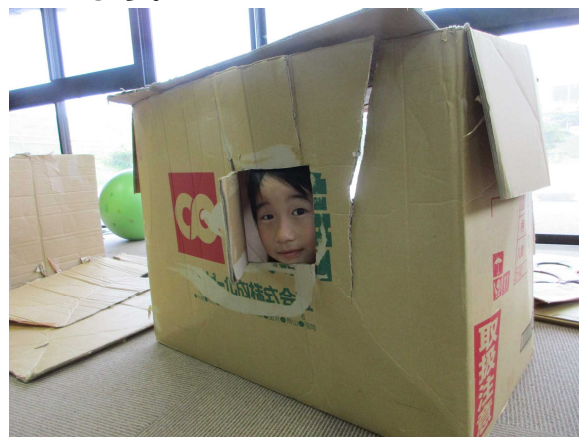
段ボール大工で楽しむ子どもたち

活動内容は、もの作り(手芸・工作)と季節の行事を中心に参加した子どもたちからの提案を取り入れて決めています。最近のお気に入りの活動は、段ボールの家作りで、自分たちのことを段ボール大工さんといって楽しんでいます。