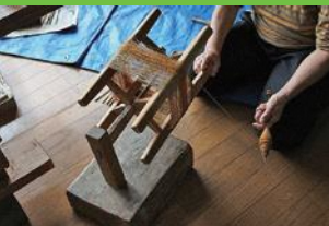
【14】粹移し 高速回転でつむ玉から木枠に取り付け乾燥させる