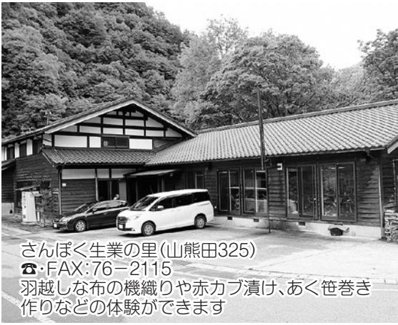
さんぽく生業の里(山熊田325) ☎・FAX:76-2115 羽越しな布の機織りや赤カブ漬け、あく笹巻き作りなどの体験ができます