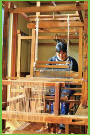
【21】機織り 糸の色や太さを気遣いながら、幅を合わせて織る