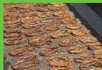
【9】天日干し しっかり乾燥させることで長期保存可能な糸材料になる