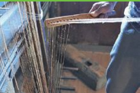
【15】糸へり 天井や壁を使って長い糸の束を作る