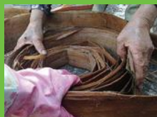
【4】樹皮を巻く 樹皮を渦巻き状にする