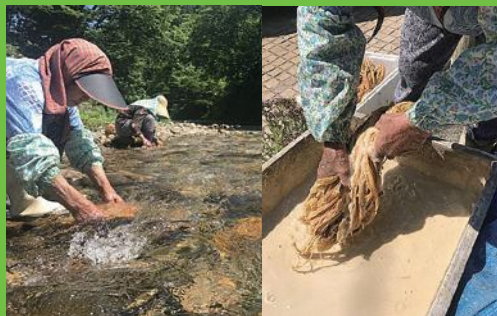
【8】ぬかに漬け川で洗う 米ぬかをまぶし、水を加えて2、3日漬けたあと、ぬかが残らないように清流で洗い流す