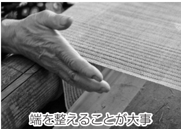
端を整えることが大事

3人も同じ答えが返って来ました「端の部分をしつかりとさせ、織り幅をぶれないようにすることだね」。