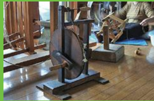
【20】くだ巻き 横糸を通すシャトルに管糸を巻く