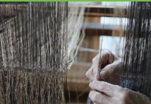
【17】おぜ通し 経糸可動部の針金の穴に糸を通す