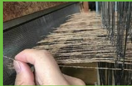
【18】おさ通し 細いおさの隙間に順番どおりに糸を通す