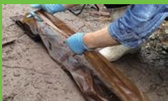
【6】あまたて・へぐれたて 煮あがった樹皮を一枚ずつはがす