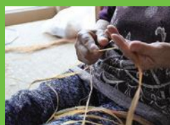
【10】しなさき 樹皮を爪と指で裂く。均等幅に裂いて糸にして、束ねる