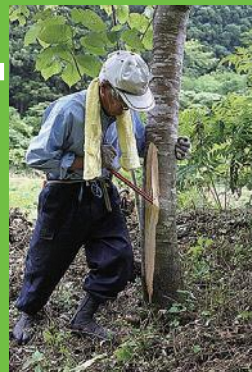
【1】しなへぎ シナノキの樹皮をはく。