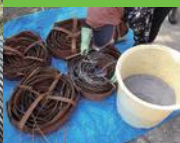
【5】しな煮 繊維以外を溶かすため、樹皮に灰をまぶしドラム缶で煮る