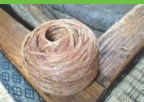
【12】へそかき かごに溜まった糸を親指に絡めて巻く