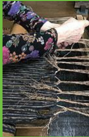
【19】織りつけ布に結ぶ 糸を束ね、巻き取る軸棒の布に縛りつける