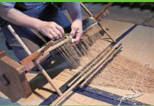
【16】機巻き 絡まり防止や等間隔にするための作業