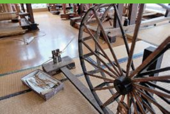
【13】しなより 糸車を使って、糸によりをかけたつむ玉にする