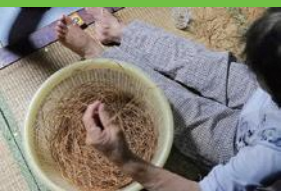
【11】しなうみ 裂いた糸同士をねじり合わせて一本の長い糸にし、かごにためる