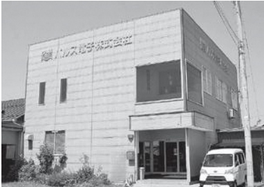
パルス電子株式会社 (若葉町15-36) 電子部品製造業 従業員 21人 ☎52-6950