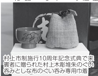
村上市制施行10周年記念式典で来賓者に贈られた村上木彫堆朱のぐい呑みとしな布のぐい呑み専用巾着