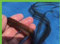
【7】しなこき 不純物などを棒などでしごき落とす