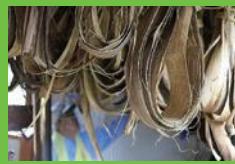
【2】樹皮の乾燥 繊維を強くするため乾燥させる