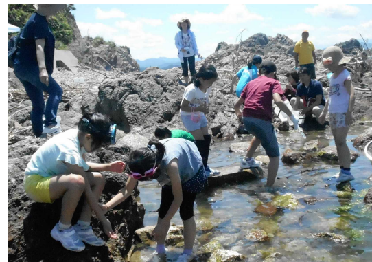
磯の生き物に夢中

6月17日(日)に、今年度初めてのわんぱく自然塾「磯遊び」が岩ヶ崎地区の海岸で行われました。暑い日差しが照りつけていましたが、波も穏やかで絶好の磯遊び日和となりました。子どもたちは我先にと海に入り、カニや貝などの磯の様々な生き物を見つけました。