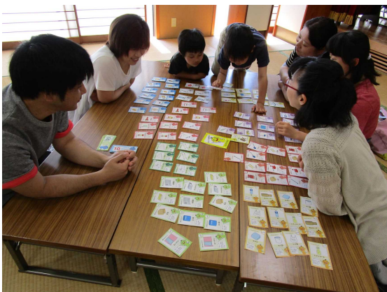
選択肢はカードの数だけあります

講師が紙芝居を使って「こんな時には、どんな道具をどう使えばいいかな?」と具体的な事例を挙げ、参加者は話し合って道具を選びます。災害時、普段と違う状況でも手に入りやすい物は何か?どう使うか?大人も子どもも意見を出し合い、出した答えがベストな時は歓声が!