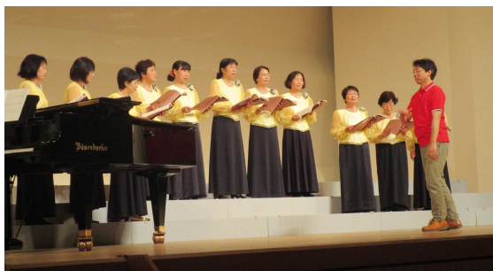
それぞれの参加団体が日々の成果を披露しました