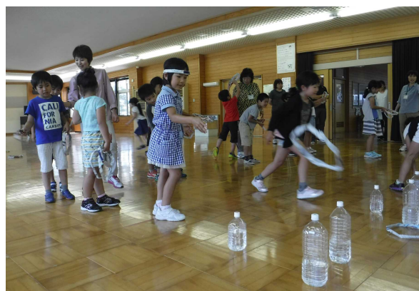
うまく入ったかな？

上手に輪が作れる子、ちょっと苦手でスタッフにサポートしてもらおう子、最初に巻いた鉛筆が取れなくなり友達に手伝ってもらおう子などさまざまでしたが、最後はみんなで輪投げを楽しみ大いに盛り上がりました。