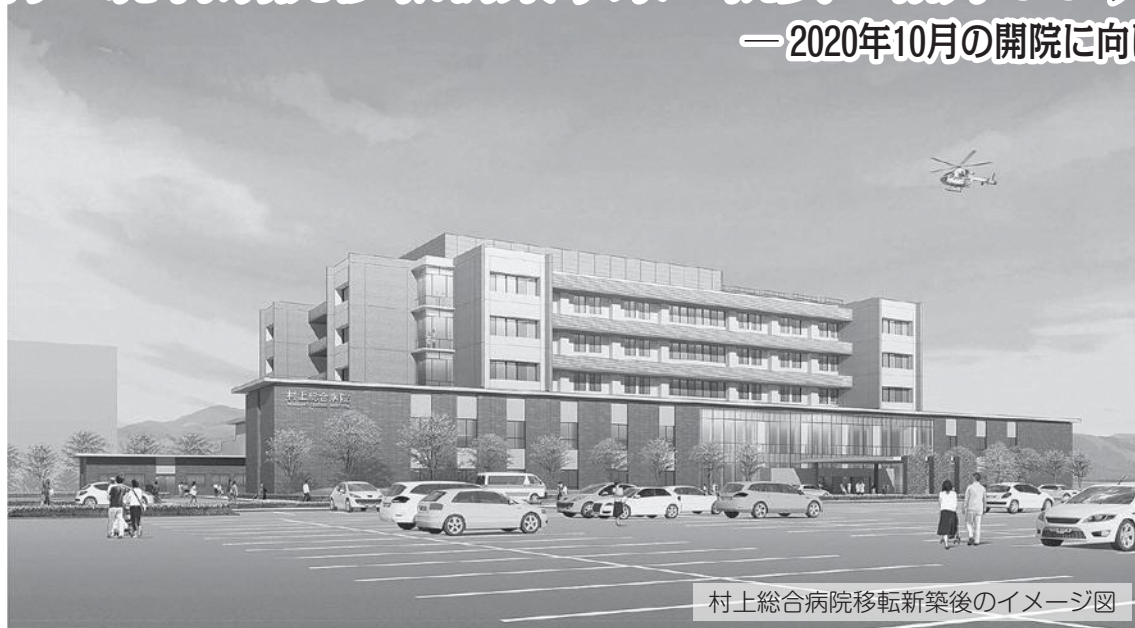
村上総合病院移転新築後のイメージ図

村上総合病院では、病院建物の老朽化などから、現在、村上駅西側への移転新築に向けて準備を進めています。