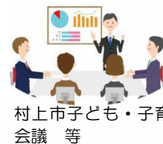
村上市子ども・子育て会議 等