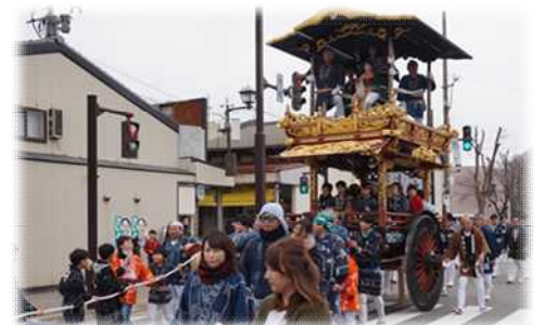
天気がよければ「トキ屋台」が春の城下町を巡行します。