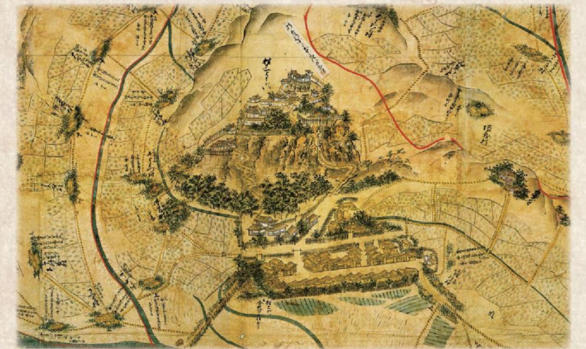
「越後国瀬波郡絵図」（慶長 2 年（1597））

越後北部（現新潟県下越地方）に位置する当地域は、戦国時代に入ると揚北衆と称された国人領主が各地に割拠し、大川氏（府屋城）や鮎川氏（大葉沢城）、本庄氏（村上城）、色部氏（平林城）などが勢力を争っていた地域です。揚北衆は、越後守護上杉氏に対してもたびたび反抗するなど独立色の強い存在でしたが、永禄 11 年（1568）の本庄繁長の反乱以後は上杉氏の支配が強まり、天正 18 年（1590）に本庄氏が改易となった後は、上杉景勝の重臣である直江兼継の弟の大国実頼が村上城主となり城代として春日元忠が入城しました。その後、慶長 3 年（1598）上杉景勝の会津移封に伴い村上頼勝が 9 万石で入封し、大規模な城普請とともに城下町の整備が行われています。この城下町の整備の際に、町人町である大町や小町が形成されたといわれています。