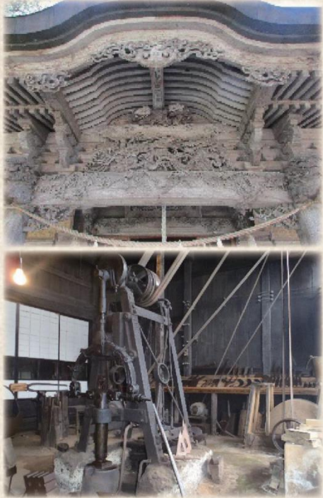
上「藤基神社社殿の彫刻」 下「孫惣鍛冶店の店内」