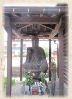
※村上天城下町区域内には、8体の九品仏が設置されており、残りの1体は、旧瀬波町内の旧出羽街道沿いに設置されています。

村上天城下の九品仏(石仏)は、1ヶ所にまとまって設置されていないことが特徴で、城下の入り口など9箇所に設置されています。この石仏は、宝暦8年(1758)に光徳寺の最善善理上人が、村上天城主内藤氏の家祖、内藤信成の150回忌供養のため村上天城下及び瀬波町に発願建立したもので、九品は、極楽浄土にある九つの階級であり、極楽往生するといずれかの浄土に行くことができるといわれており、九品仏はその浄土にいる阿弥陀の来迎の姿とされ、上品上生から下品下生までの九つの姿は印(手の形)の結び方が異なります。