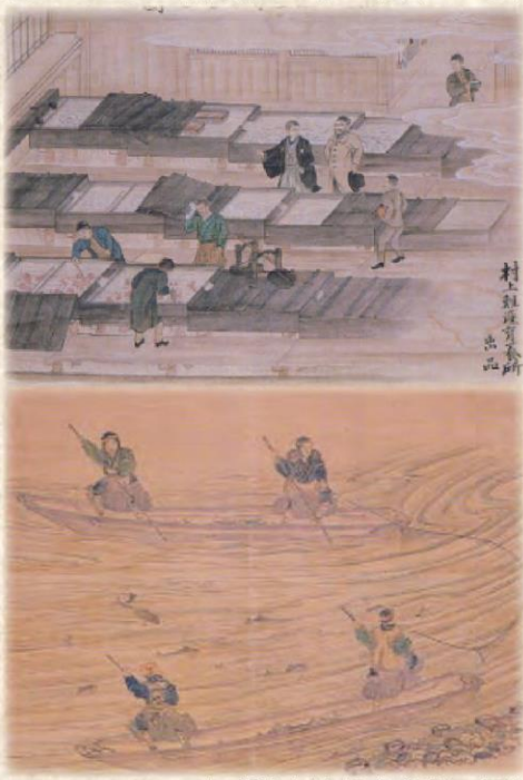
上「村上鮭産育卵場の図」 下「三面川鮭居繰り網の図」

三面川の畔に建つイヨボヤ会館では、初冬の時期になると塩引き鮭を作る体験イベント「越後村上三ノ丸流鮭塩引き道場」を開設し、歴史的建造物が多く現存する出羽街道沿線の庄内町の通りでは「塩引き街道」と称し町家の軒下に吊るされた塩引き鮭を間近で見ることができます。